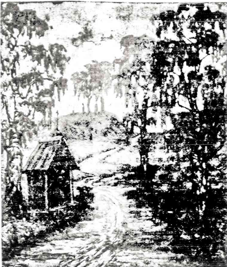
IGNAS SLAPELIS Gamtovaizdis (Alieju)

- Jei žinote asmenis, kurie galėtų užsakyti Naujienas, pra- šome atsisiųsti jų adresus. Mes jims atsisiųstysime dvi sa- vaites nemokamai.