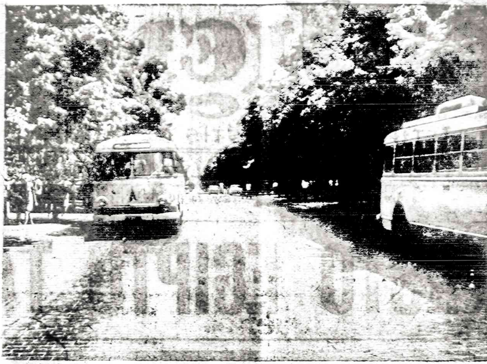
Vilniuje buvusi Gedimino gatvė, dabar skulptūrinė vadinama Lenino prospektu

Normaliai, pacientas neatitina Pas gydytoją vien dėl deginimo ties duobute žmogus, turėdamas tokį deginimą, dar turi nuolatinių gilių skausmą aukštai ties krūtinkauliu atsiduodantį į nugarą. Tas skausmas skiriamas nuo tokio skausmo, kuris jau-