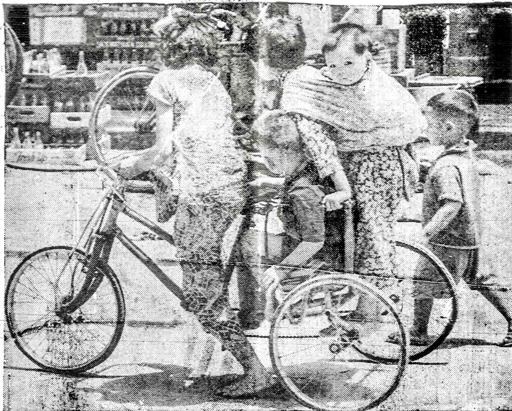
Kinija užsako šimtus sprausminių lėktuvų Anglijoje, bet pačioje Kinijoje pagrindinė darbo jėga yra raumenyse. Paveikale matome kiniečius, vežiojančius keleivius ir prekes.

— Paryžiuje gyvenantis mulla Avatalia Chomeini norėtų grįžti į Iraną, bet nenori, kad prokuratūra jį tardytų apie kurstymą maištauti.