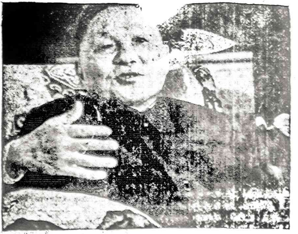
Kinijos vicepremjeras Tengas, pamatęs, kad Vietnamas nenori taikos sąlygų Pietų Azijoje, išakė užsienio reikalų ministeriui nutraukti derybas su Vietnamu ir grįžti į Pekiną.

Kinija tikisi netrukus pradėti derybas su Sovietų Sąjunga. Jeigu Vietnamas jau tapo Sovietų Sąjungos satelitu, tai Kinijai geriau tartis su pačiais rusais, negu su vietnamiečiais, su kuriais negalima susitarti. Vietnamo užsienio reikalų ministeris negali daryti jokio sprendimo. Jis sako, kad pirma turi pasitarti su savo vyriausybe, bet tikrovė yra visai kitokia: Vietnamas pirma priverstas atisklausyti Maskvos. Kinija mano, kad jai bus geriau tartis su pakariais ir administracijos atstovais Maskva, negu su josios išvys. Vietnamas norėjo, kad Kinija atšauktų savo karus iš Vietnamo pasienio, bet nieko iš to neišėjo, nes derybas teko nutraukti.