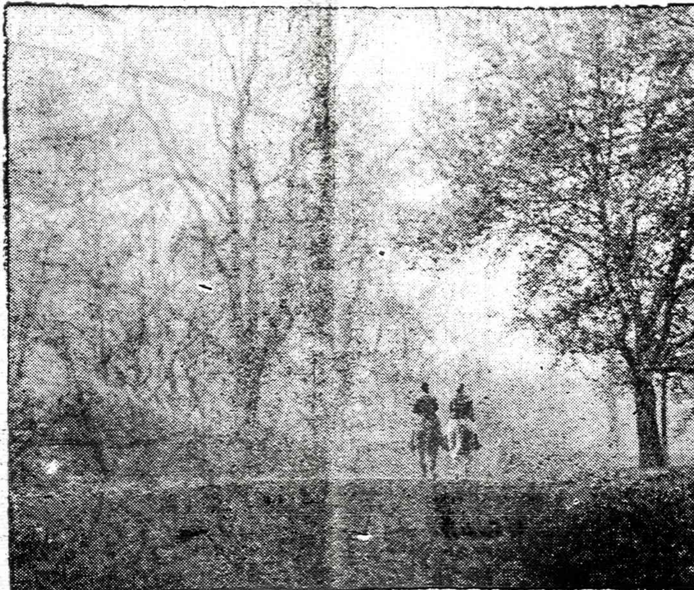
Chicaga jau žaliuoja, o New Yorkas dar be lapų. New Yorko parko vaizdas trauktas greitą savaitę.

JAV nori, kad Kuba pirma sumokėtų už nusavintus amerikiečių turtus ir atiduotų Kubos bankuose buvusius amerikiečių pinigų, sumokėtų už Kubai parduotas ir nusavintas prekes. Castro nenori kalbėti apie nusavintus amerikiečių bizneso ir pinigų, bet nori pradėti naują prekybos lapą. Meksikos prezidentas taip pat prašo Ameriką pradėti prekybą su Kuba, bet