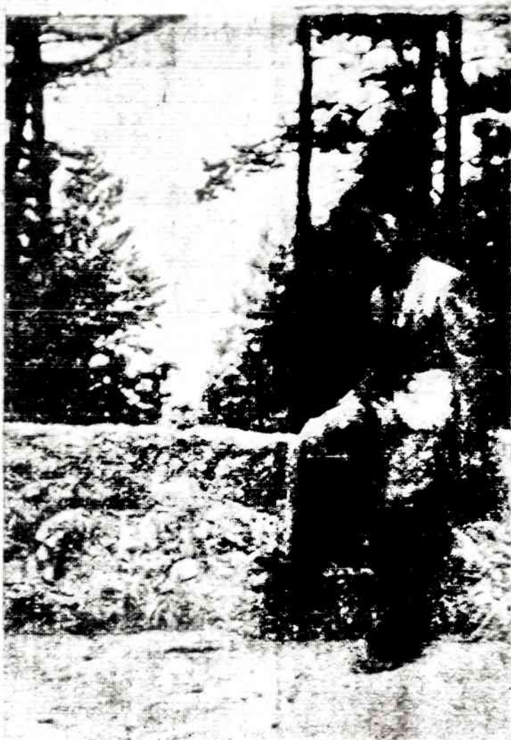
Ant Birutė kalno

NAUJIENŲ raštinė atdara kasdien, išskyrus sekmadienius, nuo 9 val. ryto iki 5 val. popiet. Šeštadieniais — iki 12 val.