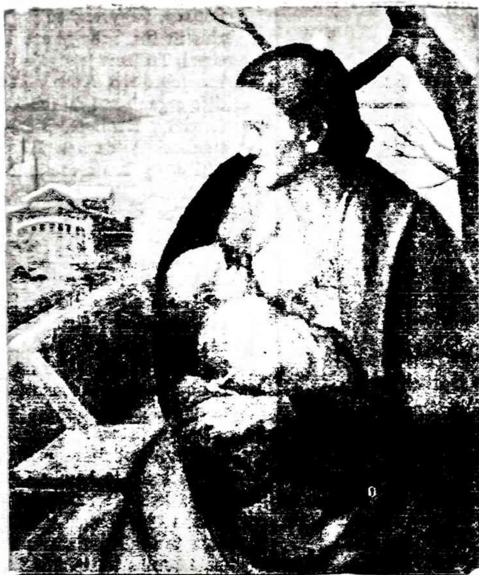
M. Šileikis Potvynio madona

A major advancement CUSHION GRIP DENTURE ADHESIVE one application holds comfortably up to 4 days