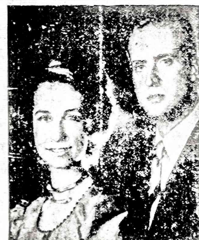
Generolai, Francisco Franco režimo šalininkai, norėjo nuversti karalių, bet Ispanijos pulkininkai ir aviacija pritaria demokratinei tvarką ginančiam karaliui Juan Carlos.

Pietų Afrikos ir JAV santykiai gerėja. P. Afrikos užsienio reikalų ministris R. Botha lankėsi Baltuosiuose Rūmuose ir kalbėjo su prez. Reaganu.