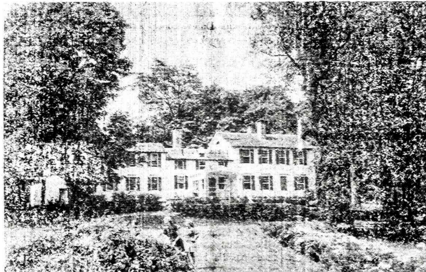
Devenių dvaras Lietuvoje

Sąryšy su rusų — lenkų karu 1919-1920 metais, lenkai buvo piversti laikinai palikti Vilnių, kuris buvo rusų užimtas ir pagal 1920 metų, liepos mėn. 12 d. sutartį, pažadėtas Lietuvai. Kai nugalėtojai lenkai 1920 metais spalio 9 dieną vėl užėmė Vilnių, jie ten rado lietuvių kariuomenę, kurią jie po įvykusių kautynių išvarė. Tuo Maskva pasirūpino sukurti kovos židinį