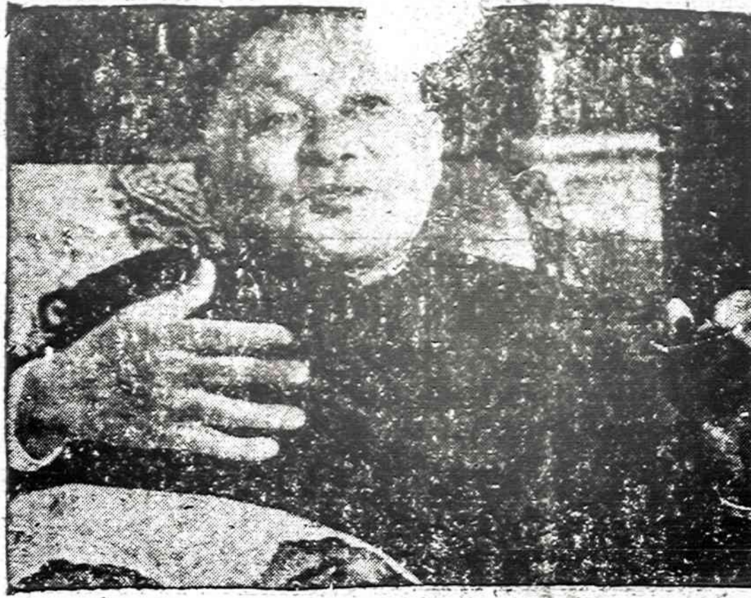
Viceprezidentas Tengas Hsiaoingas ir toliau vadovaus Kinijos apygardų viršininkų tarybai, o komunistų partijai vadovauti išrinktas reformistas Hu Jaobangas.

Sekretorius A. Haig paneigė Irano valdžios paskelbtą tvirtinimą, kad amerikiečiai buvo įvelti į bombos padėjimą Islamo respublikonų partijos centre. Jokia JAV įstaiga neprisdėjo prie sekretorių Teherano įvykusio sprogdimo.