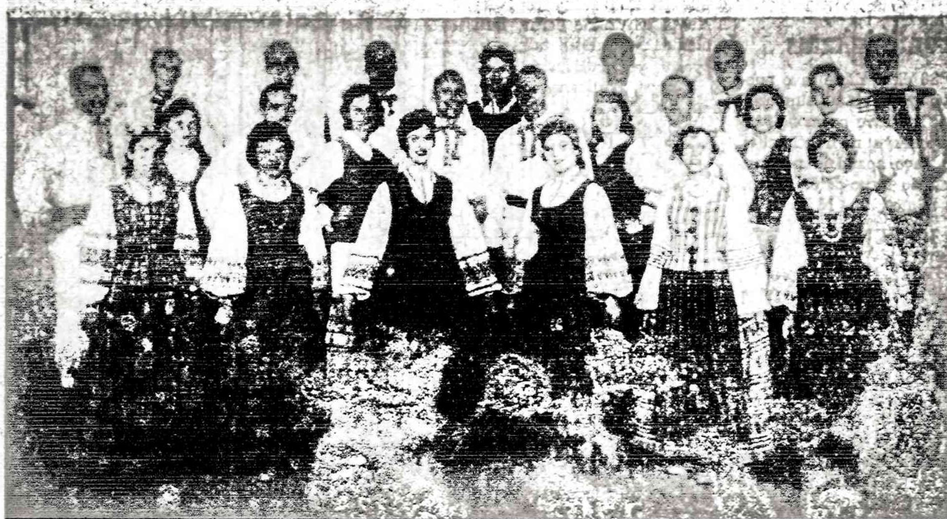
Chicago "Ateities" šokėjų grupė, dalyvavusi 1957 metais Pirmojoje Tautinių Šokių šventėje Chicagoje

Be tėvynės meilė nėra tik sentimentas ir jausmai. Ji yra realus ryšys, jungiantis žmones vienybės brolišką meilę. Ji yra amžinoji teisė, Dievo įrašyta žmogaus širdyje. Tai meilė, kuri išplaukia iš Dievo nustatytos tvarkos. Todėl mano tos gražios tėvynės ir mielos tėviškės meilė mane lydi visą mano gyvenimą. Ir tai dėl to, kad toji meilė turi pradžią Dievo meilėje. Su Dievo meile ji