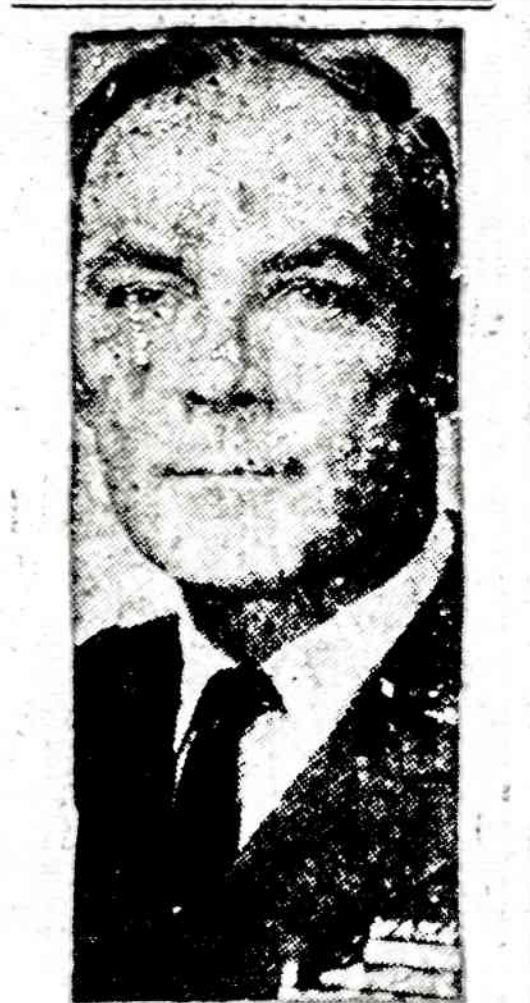
Sekr. A. Haig yra įsitikinęs, kad Argentina turi atšaukti savo karių iš Falkland salų.

Prezidentas nutarė praleisti porą dienų atostogų pas savo seną pažįstamą, kino artistę Claudette Colbert. Barbados saloje artistė Colbert turi vilą, kurią ji pakvietė prezidentą praleisti Velykų šventes.