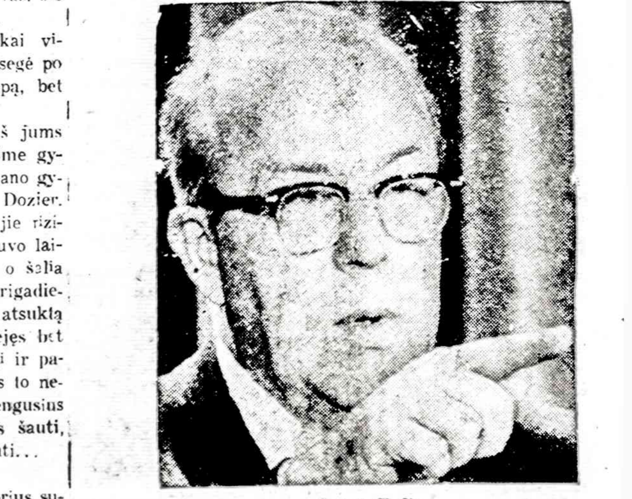
George Shultz Sekr. Shultz tris dienas praleis Japonijoje, o vėliau skris į Pekiną, kur kelias dienas tarsis su krašto valdovais.