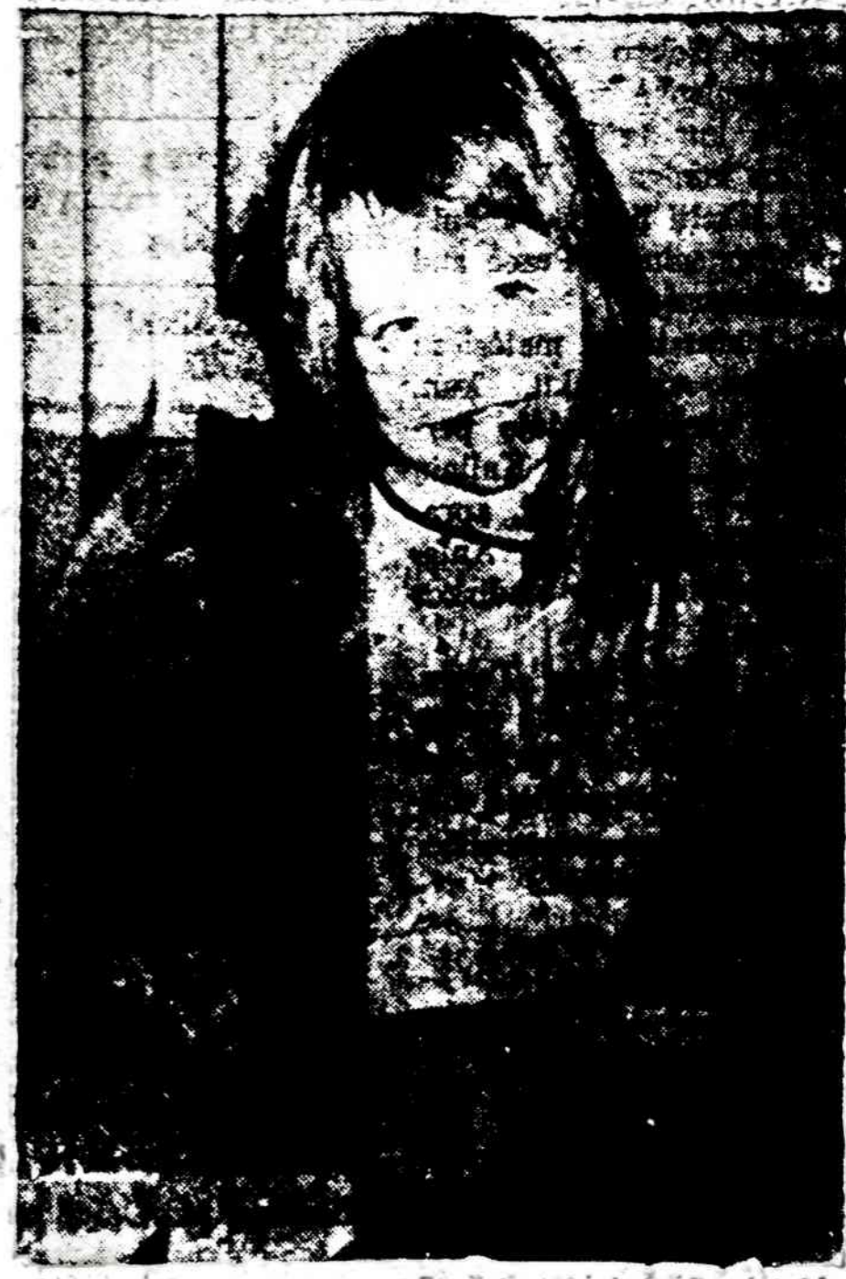
Mergaitė buvo pabėgusi iš namų, bet pasikėlo galus su motina, nutarė grįžti.