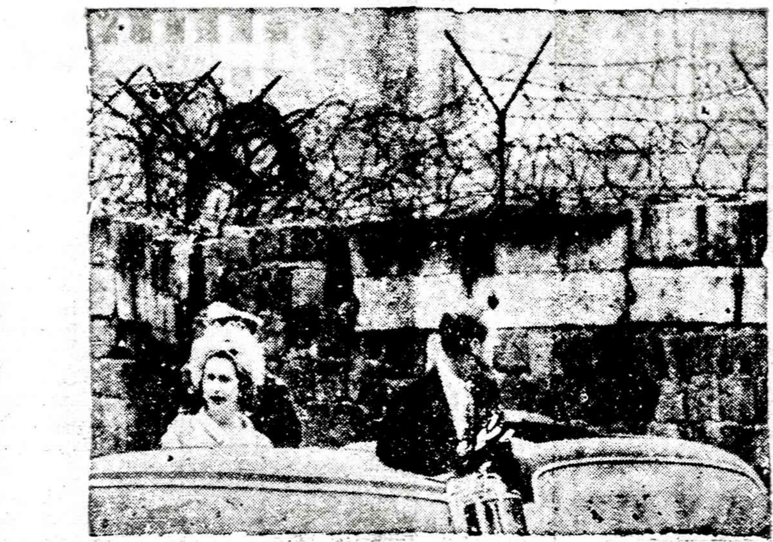
Rusai sustiprino sargybas prie Berlyno sienos. Paskutiniu metu didesnis vokiečių skaičius bėga iš Rytų į Vakarus.