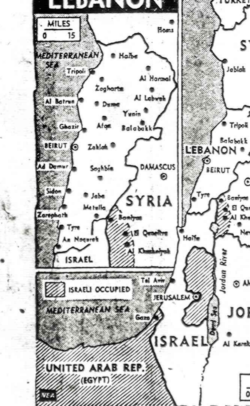
Nutarta dviejų savaičių laikotarpyje atšaukti Izraelio karo jėgas iš Libano.