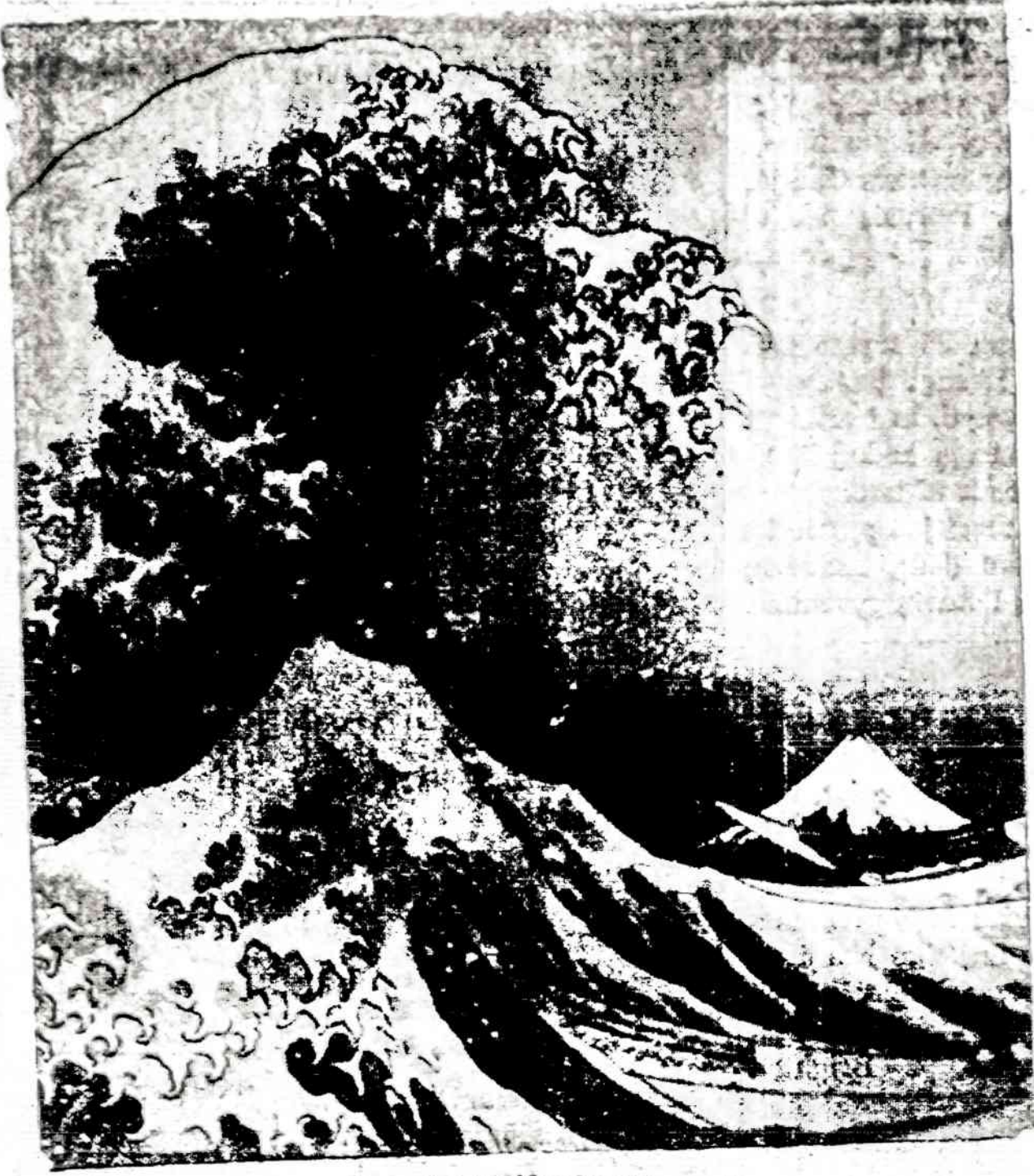
Japonų jūrų bangos

• Neparduok kailinių, kol dar ne pavasaris.