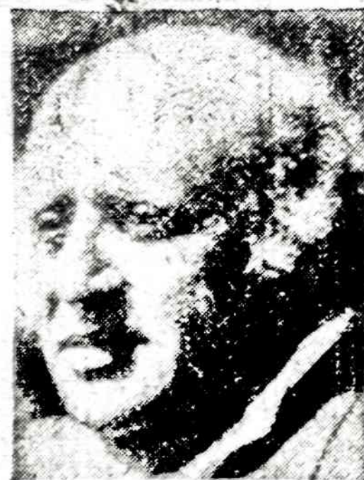
Turkijos prezidentas Kenan Evren sekmadienį leido politinėms partijoms veikti, jei prisilaikys veikiančios krašto konstitucijos.

— Jungtinių Tautų Saugumo taryba svarsto Nikaraguos politinę būklę. Kalbas nori pasakyti 52 valstybių atstovai.