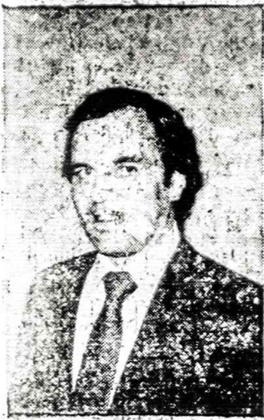
Richard M. Daley

RICHARD M. DALEY PATIESE UŽPUOLIKĄ ANT GRINDŲ, ATŠIRADO POLICIJA