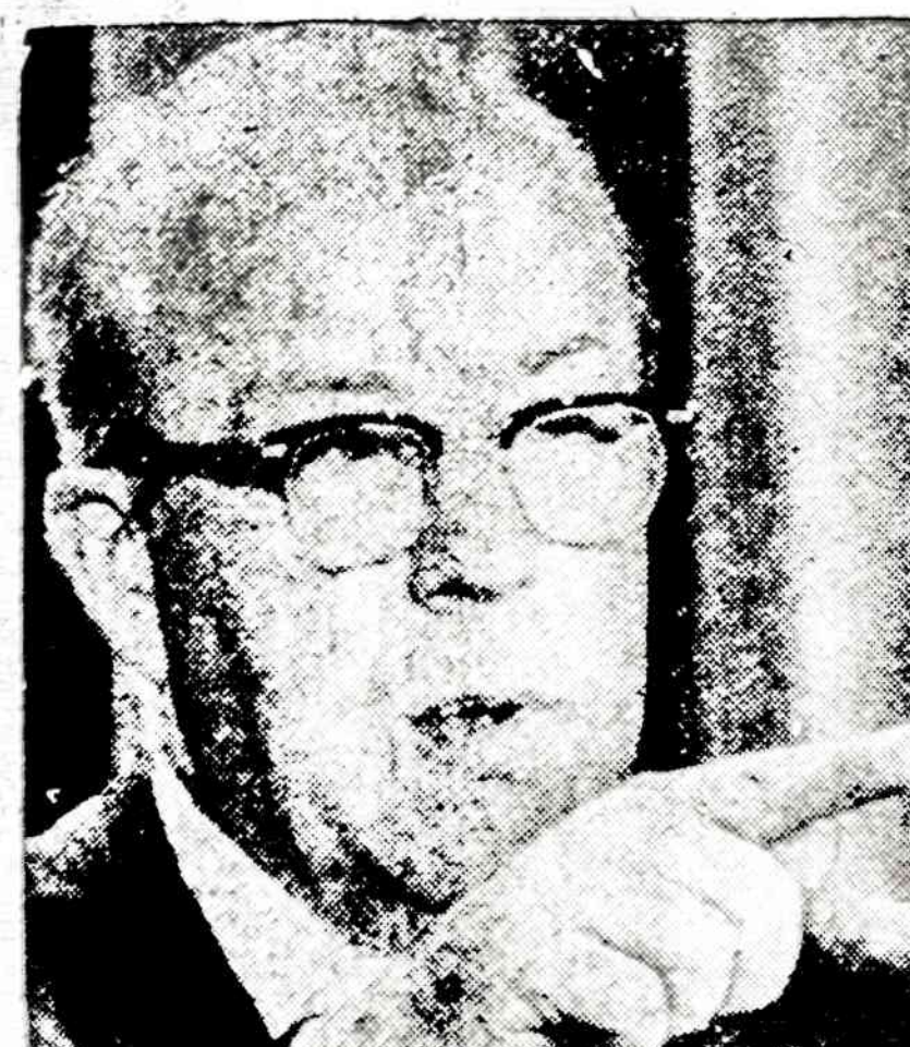
George Shultz Valstybės sekretorius G. Shultz pirmadienį pralaido Egipte, tarėsi su prezidentu Mubāraku.

— Irano valdovai buvo išsistiktę su Irako prezidentu baigti kovas, bet dabar ir pakelė savo nuomonę.