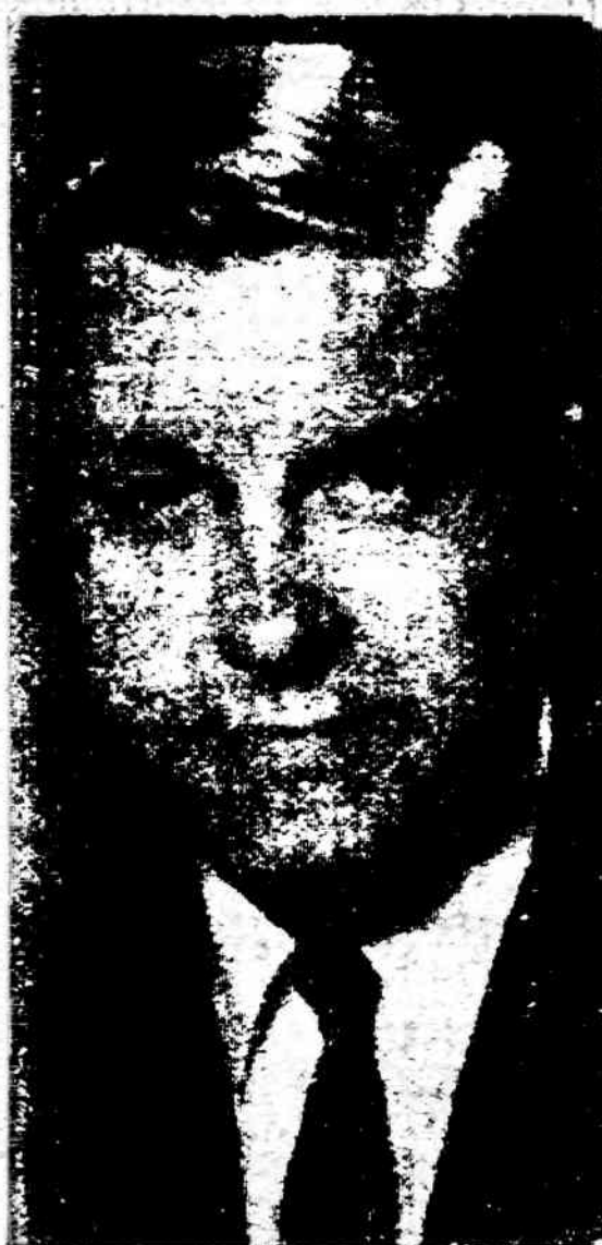
Senatorius Charles Percy