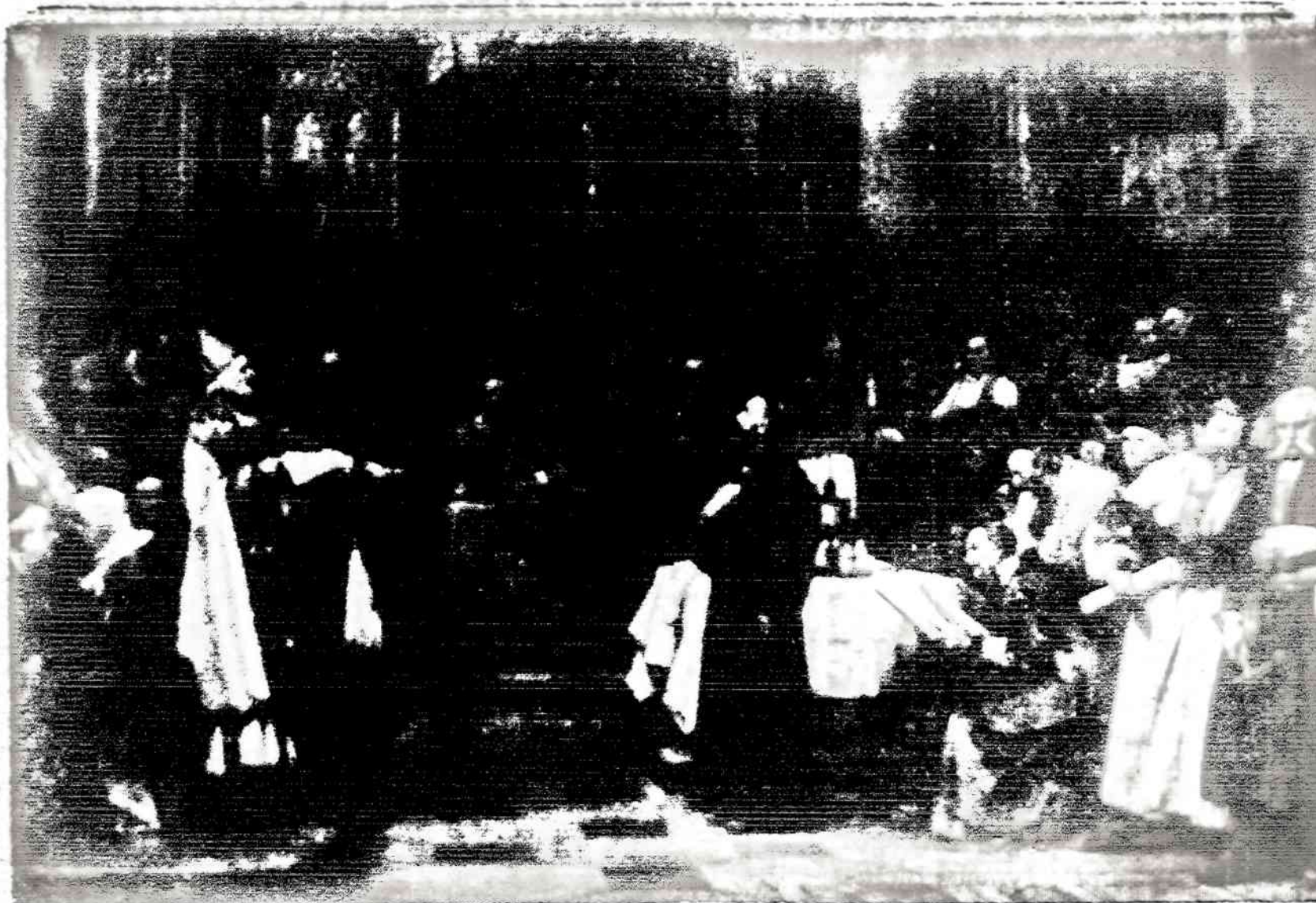
Jono Huso teismas

— Chicago's meras ir kiti miesto tarnautojai sumazino savo algas, o mokytojai užsispy- rė, kad jiems būtina pakelti.