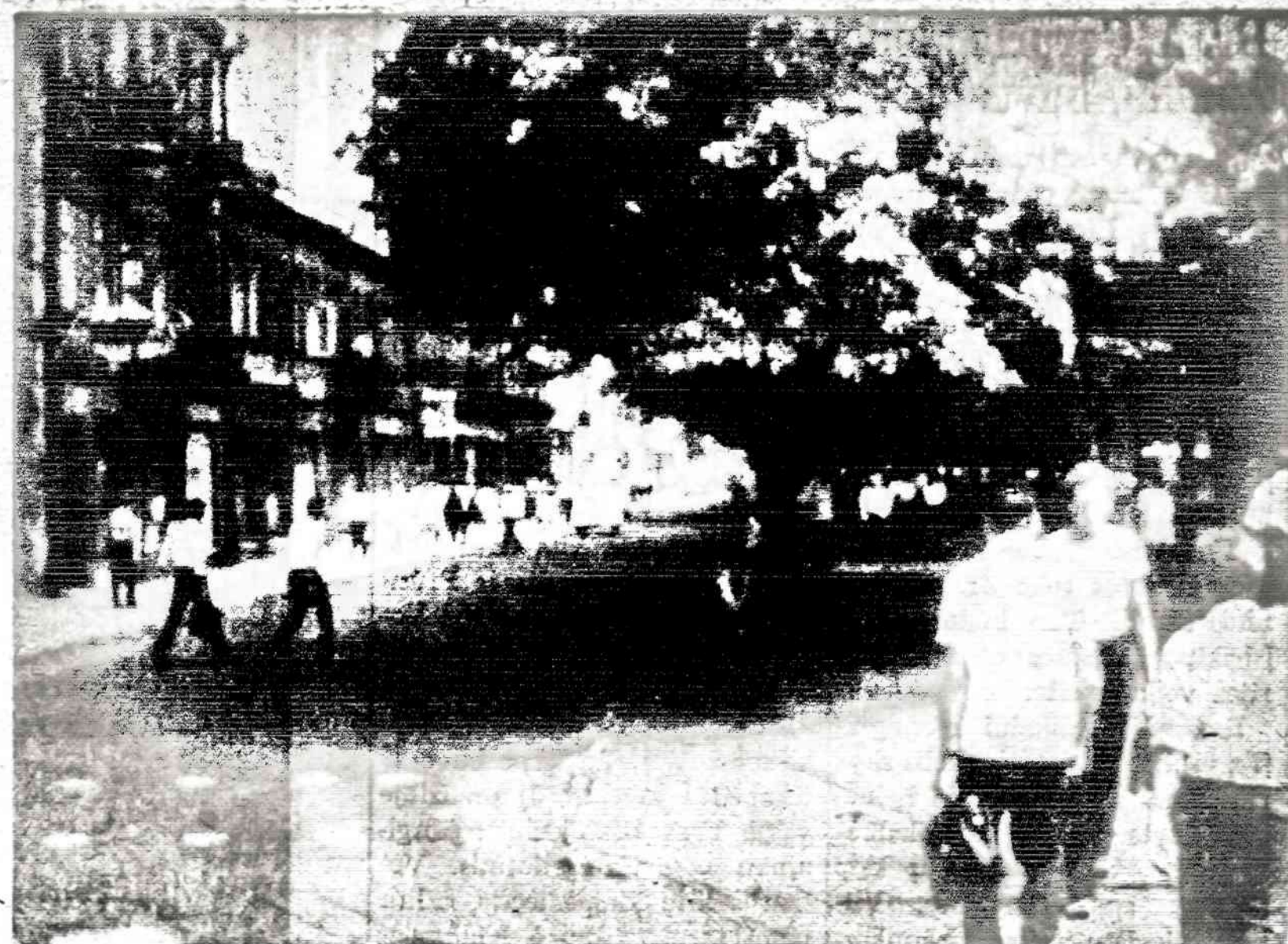
Laisvės Alėja Kaune

Senatorius Ernest Hollings buvo nušvilptas, kai jis bandė pasiaiškinti, kodėl jis Colorado valstijojei balsavęs prieš moterų teisių įstatymo projektą. Jam neleido kal-bos baigti, nes joms buvo neįdomu. Panašaus likimo susi-