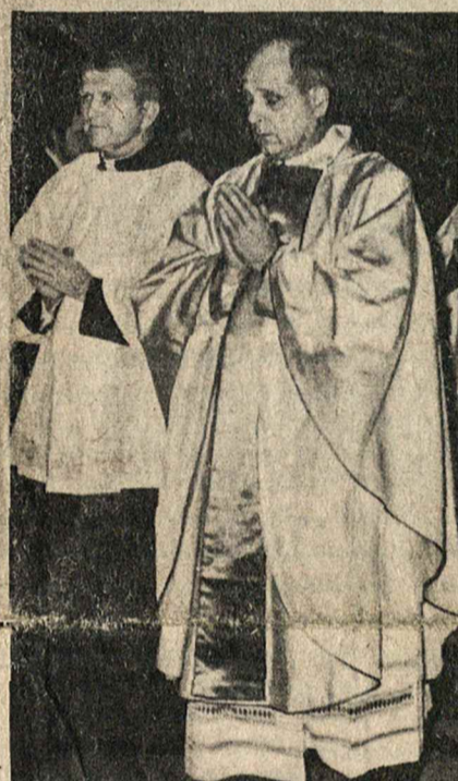
Vysk. P. Marcinkus.