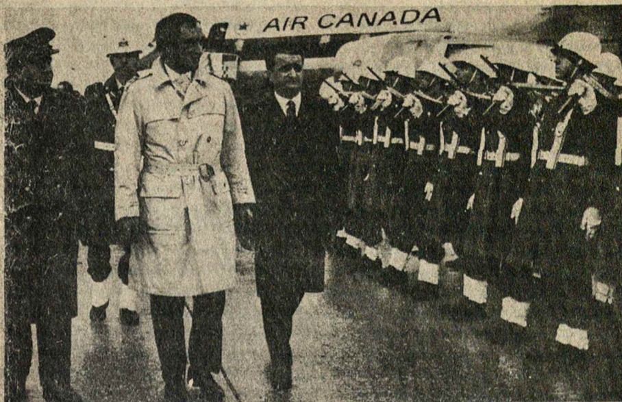
Kanados min. pirm. P.E. Trudeau Romos Fiumicino aerodrome.

Įsidėmėtina (labiausia tiems kairiesiems, kurie taip garsiai šaukė, kad tokiu būdu buvo protestuojama prieš Pietų Vietnamo režimą), kad šie jaunuoliai yra komunistinių režimų išauginti ir išauklėti, o tačiau, net save susinaikindami, įrodo kaip gliaulai yra išsiskakiję žmoguje laisvės troškimas.