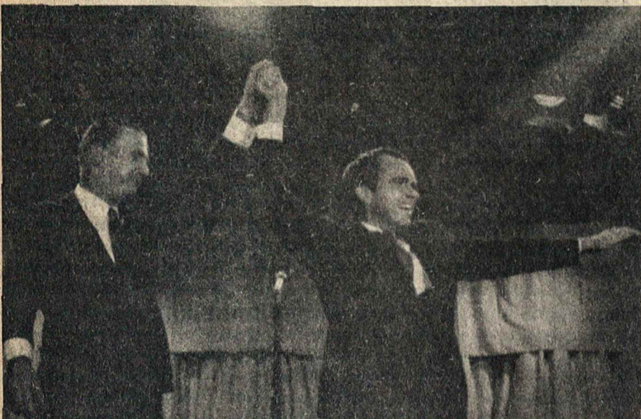
JAV-bių prezidentas R.M. Nixon ir viceprez. S.T. Agnew (iš dešinės).