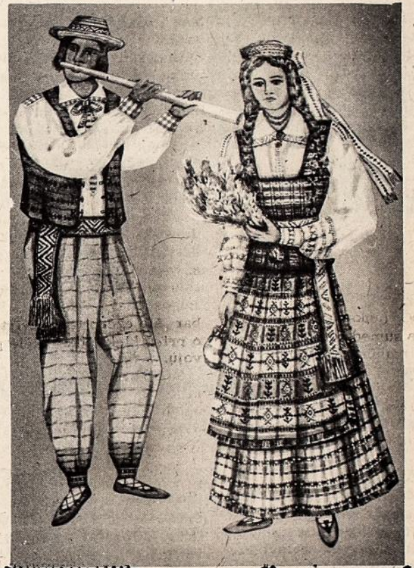
Iš Antano ir Anastazijos Tamošaitis' knygos LITHUANIAN NATIONAL COSTUME

krūvas, palikdami tik siaurus praėjimus prie grotuotų langų.