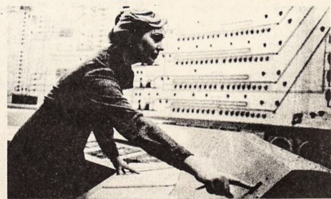
Praplėstame ir pagerintame linų fabrike Panevėžyje:

● Kauno Lėlių Teatre pastatyta A. Gudelio pjesė vaikams "Žvaigždės Vaikas". Režisavo A. Stankevičius, dailininkas - V. Mazūras, muziką sukūrė komp. M. Urbaitis.