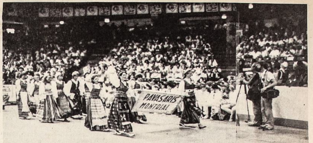
Montrealio "Pavasaris" įžygiuoja i Dainų Šventės koncertų arena Chicagoje. Tūkstantinė publika mergaites labai šiltai priėmė ilgais plojimais.