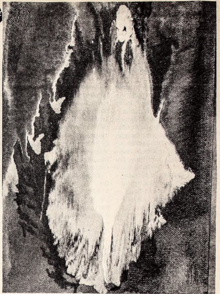
Didžiojo Inkvizitoriaus dvasia. Pr. Baltuosius - Aliejus

Kaip jau minėta, po Stalino mirties Igarkeje tremti -