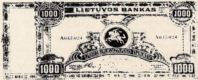
Nepriklausomos Lietuvos banknotas