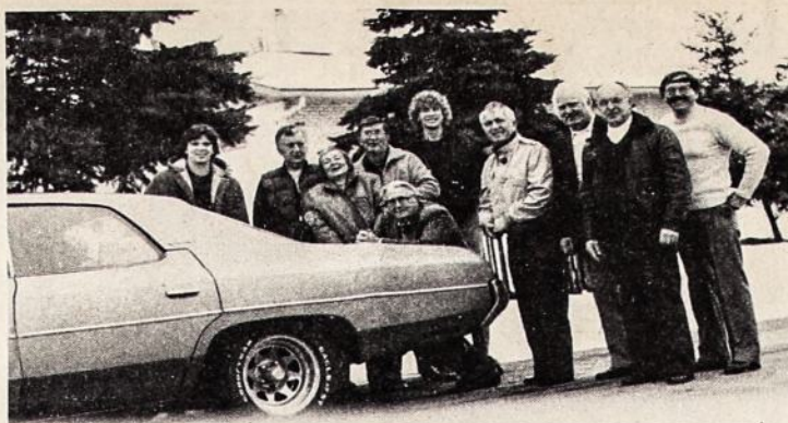
Montrealio Vyrų Oktetas pasirengęs išvykoti į Bostoną.

DARBO VALANDOS: pirmadieniais, antradieniais ir ketvirtadieniais nuo 10 v.r. iki 5 v.p.p., trečiadieniais nuo 10 iki 1 v.p.p., penktadieniais nuo 10 v.r. iki 7 v.v., šeštadieniais nuo 9 v.r. iki 12 v.r.