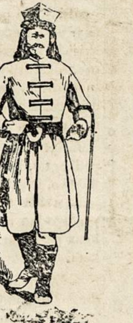
Tegul bus pagarbintas J. Chr.

Papjowe 40 moteriu. Berlinas, Sau. 29 - Skust- barzdis wadinantis kekulla ta- po areztuotas uz papkowima- dwieju moteru perejta nakti. Tas pat wiras du metus adga- los nuzude in 40 moteriu, ku- riu lig sziam lajkuj kunu ne- suranda.