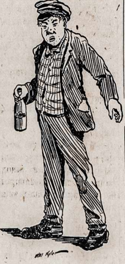
PILOZOPIJE DŽIN NIRBIRIO.

TURIME VISOKIU DIDUMU. 8 pedas ir 3 coli per 10 pedu ir 6 coli. 9 pedas per 12 pedu. 11 pedu ir 6 coli per 12 pedu. 12 per 15 pedu. Yra isz ko pasirinkti. Geras Brussel karpetas $1.50 mastas. Geras Pluszinis karpetas $2.50 mastas Geras Axminster karpetas $3.00 mastas Klijonke 2 mastu ploczio $1.50 mastas