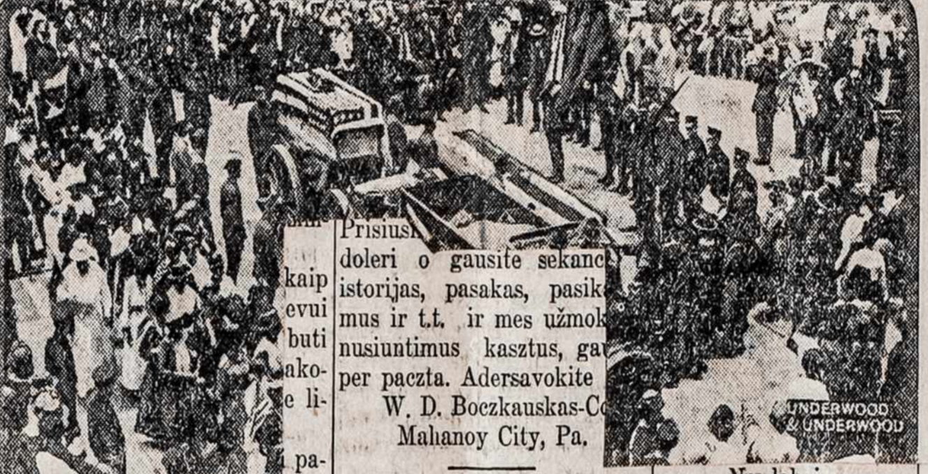
Ana diena likos pargabenti veiklas parodo parvežima pr...

Prisiusa doleri o gausite sekanc istorijas, pasakas, pasik mus ir t.t. ir mes užmok nusiuntimus kasztus, ga per paczta. Adersavokite W. D. Boczkaukas-C Mahanoy City, Pa.