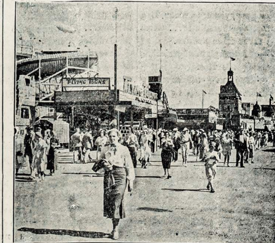
Karnavalo ulyezia arba "Milday" Svetinej Iszkelmėj Chicagoje, kur randasi visoki stebetini parozymai ir pasilinksminimai suagusiams ir vaikams, ypacz naktimis szia vieta atlanko tukstancziai žmoniū.

Fotografistas atkreipes savo kamera in virszu nutrauke szita nepaprasta paveiksla boksztu kuris turi 628 pedas augszczo, vadinamas "Sky Ride." Yra tai vienas išz dviejų tokiu boksztu kurie kasztavo milijonus doleriu pastatyti ant tos Iszkilmes. Elevatorei iszkelia pasazierius ant tojo boksztu ant kuriu randasi karukai kurie yra trunkiami 1,850 pedu, 200 pedu nuo žemes. Ant paties virszaus tuju boksztu randasi platformes nuo kuriu galima prisiziureti visai Parodai ir Chicago aplinkinei ant tukstancziu myliu aplinkui. Kas karta vaziauja ant tuju karuku tai nepamirsz per visa gyvenima.