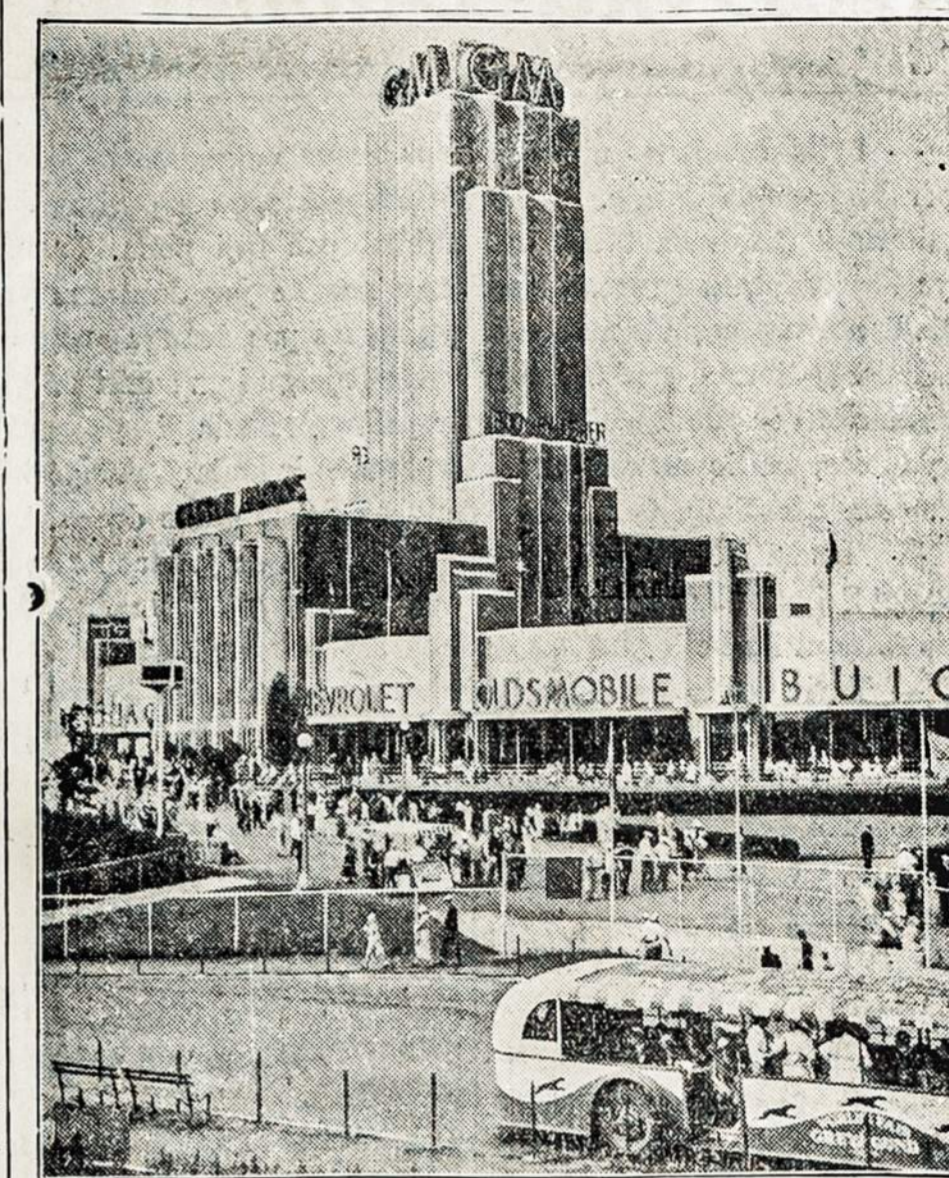
CZION PADIRBA AUTOMOBILIU PRIE JUSU AKIU.

Vienas iš svarbiu namu ant Chicagos Parodos yra General Motors kuriame pasidirba automobiliai tuojuas priesz jusu akis.