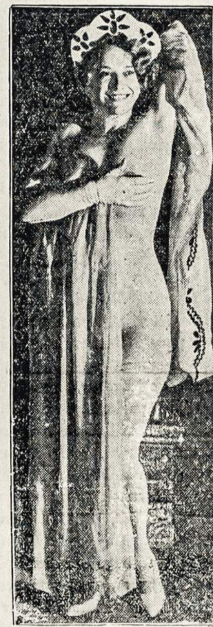
PASIREDŽIUS TIKTAI IN ILGAS RANKOVES.

TURI atnaujinta vilti apie vertes prapereziu szioj apelinkeje. Kietuju angliu yra geriausia dirbanti industrija Suv. Valstijoje ir atrodo gerai del ateities.