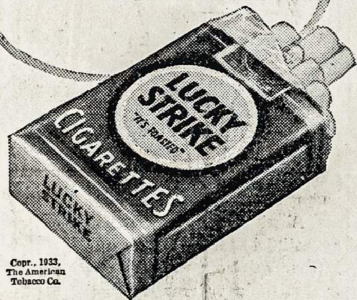
Copyright 1933 The American Tobacco Co.

VISUOMET puikiausias tabakas VISUOMET puikiausias apdirbimas VISUOMET Luchies patenkina!