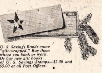
U. S. Savings Bonds come "gift-wrapped." Buy them where you bank or work. Or buy new gift books of U. S. Savings Bonds—$2.50 and $5.00 at all Post Offices.

Every Bond you give this Christmas will help strengthen America's Peace Power.