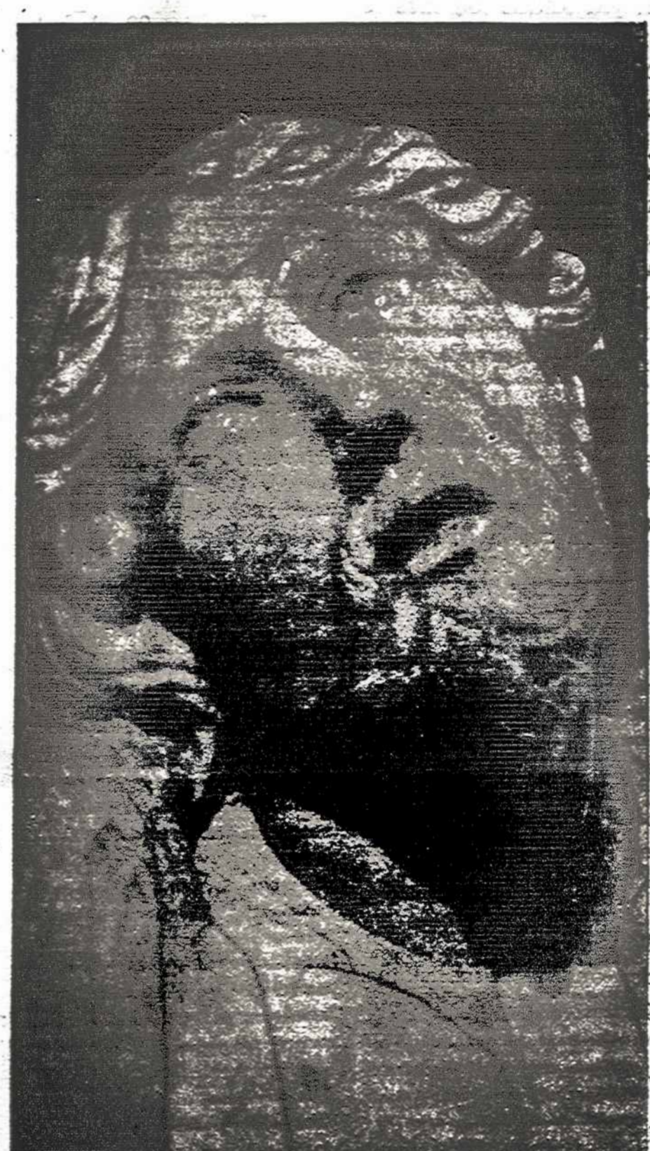
Nukryžiuotojo galva Iš Vilniaus katedros