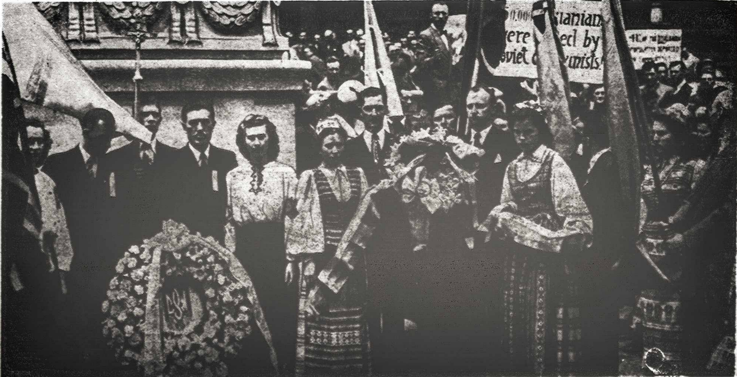
Lietuviai ir ukrainiečiai prie Nežinomojo Kareivio paminklo Toronte birželio 18 d. (Gr. praviso Nr. 1 ir 8 psl.)

— BRIUSELIS. — Iš parlamento sluoksnių pranešama, kad karalius Leopoldas į Belgiją grįšįs greičiausia liepos 21 d., Belgų tautos šventėje.