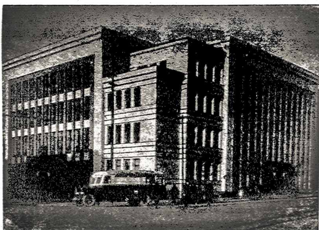
Buv. Savivaldybių departamento rūmai Kaune. Dabar čekistai čia kankina lietuvius.

SOFIJA. — Bulgarijos komunistų partijos centro komitetas paskelbė, kad 30.000 partijos narių yra beraščiai.