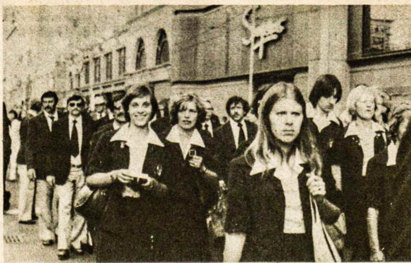
Australijos lietuvių sportininkai žygiuoja Toronto gatvėmis Pasaulio Lietuvių Dienose

JANE-BABY POINT , atskiras, centrinio plano, 6 kambarių namas; apšildomas saulės kambaris; gražus natūralus medis viduje; garažas su privačiu įvažiavimu; namas be skolų. ROYAL YORK-EGLENTON , gražus 6 kambarių vienaauštis; pilnai užbaigtas rūšys, 2 prausyklos, 2 atviri malkomis kūrenami židiniai; garažas su privačiu įvažiavimu. SWANSEA , atskiras, originalus tributis, 3 ir 2 miegamųjų, vos kelio liko metų senumo; garažai su privačiu įvažiavimu. RUNNYMEDE-BLOOR , 8 kambarių mūrinis namas, 2 mod. virtuvės; garažas su privačiu įvažiavimu; namas be skolų; prašoma kaina $64.900. HIGH PARK-BLOOR , 7 kambarių atskiras namas; kvadratinis planas, vandeniu-alyva šildomas; 2 prausyklos; garažas su plačiu įvažiavimu, netoli Bloor. ROYAL YORK-BLOOR , atskiras vienos šeimos 2 miegamųjų (5 kamb.) vienaauštis, vandeniu-alyva šildomas; užbaigtas rūšys, nemažas sklypas, garažas su privačiu įvažiavimu. INDIAN RD-BLOOR , 10 didelių kambarių atskiras namas; kvadratinis planas; garažai su plačiu privačiu įvažiavimu; namas be skolų. JANE-ANNETTE — palikimas, 5 kambarių atskiras mūrinis vienaauštis; garažas; prašoma kaina tik $55.000. 16 ĮSTAIGŲ JUŠŲ PATARNAVIMUI TORONTE IR ONTARIO PROVINCIJOJE. P. KERBERIS, 2336 BLOOR STREET WEST tel. 763-5555 namų 535-1584