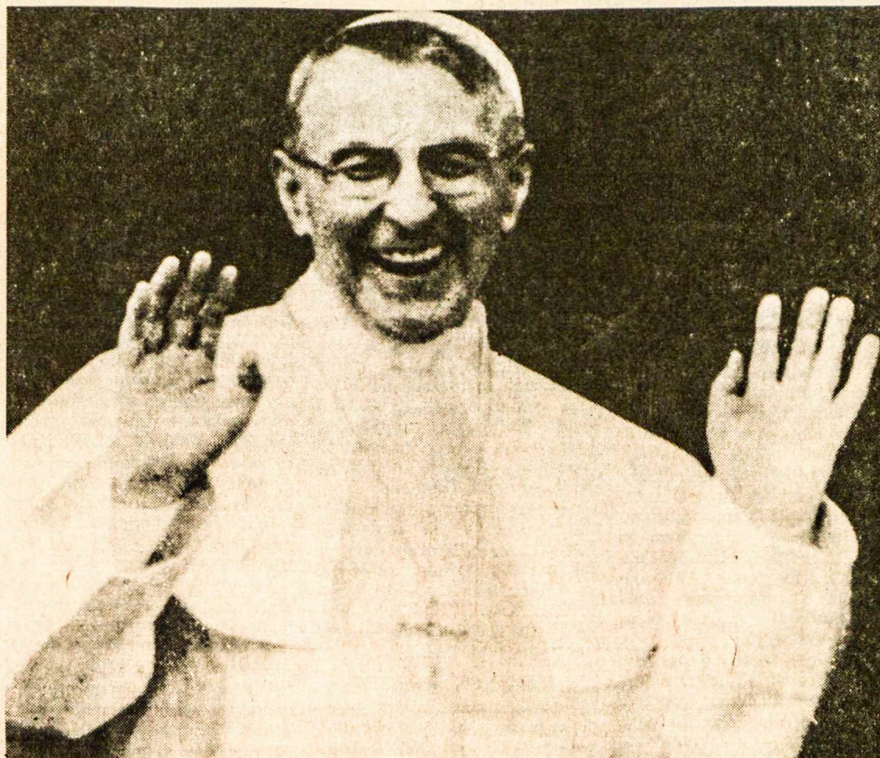
Naujai išrinktas popiežius ALBINO LUCIANI, Venecijos patriarchas, pasirinkęs vardą JONO PAULIAUS I. Jo karūnacija — rugsėjo 3, sekmadienį, Sv. Petro aikštėje, Romoje. Ją stebės per televiziją visas pasaulis