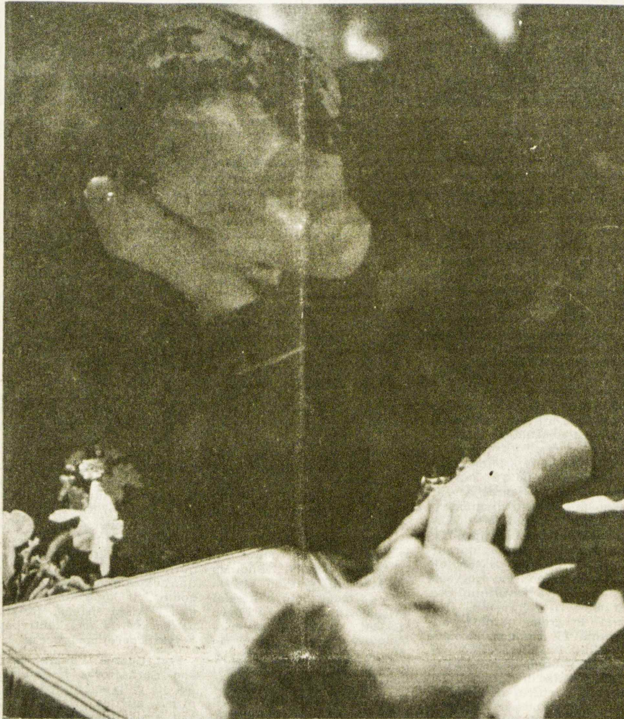
Motina gedi žuvusio sūnaus Vilniuje tragiškomis 1991 m. sausio 11-13 dienomis, ginant Lietuvos laisvę