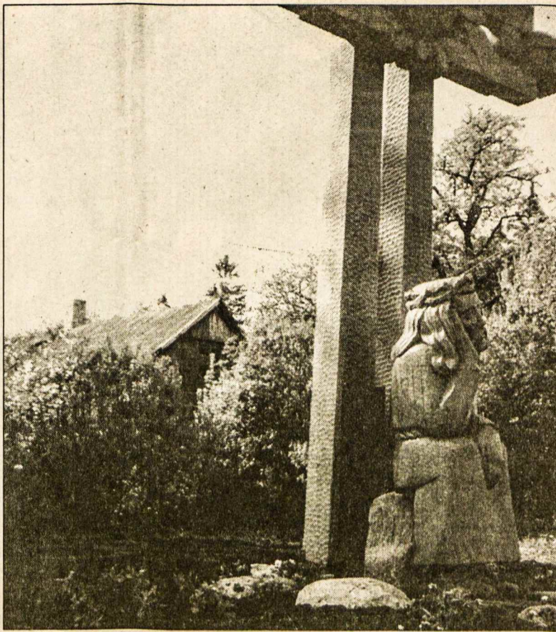
Rūpintojėlis - a.a. kun. J. ZDEBSKIO memorialinio paminklo dalis jo tėviškėje