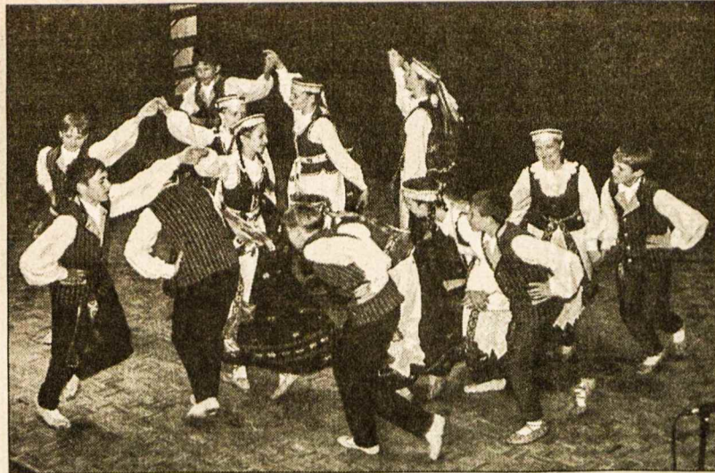
Vilniaus moksleivių liaudies meno sambūrio "Ūla" šokėjai koncerto programoje Toronte