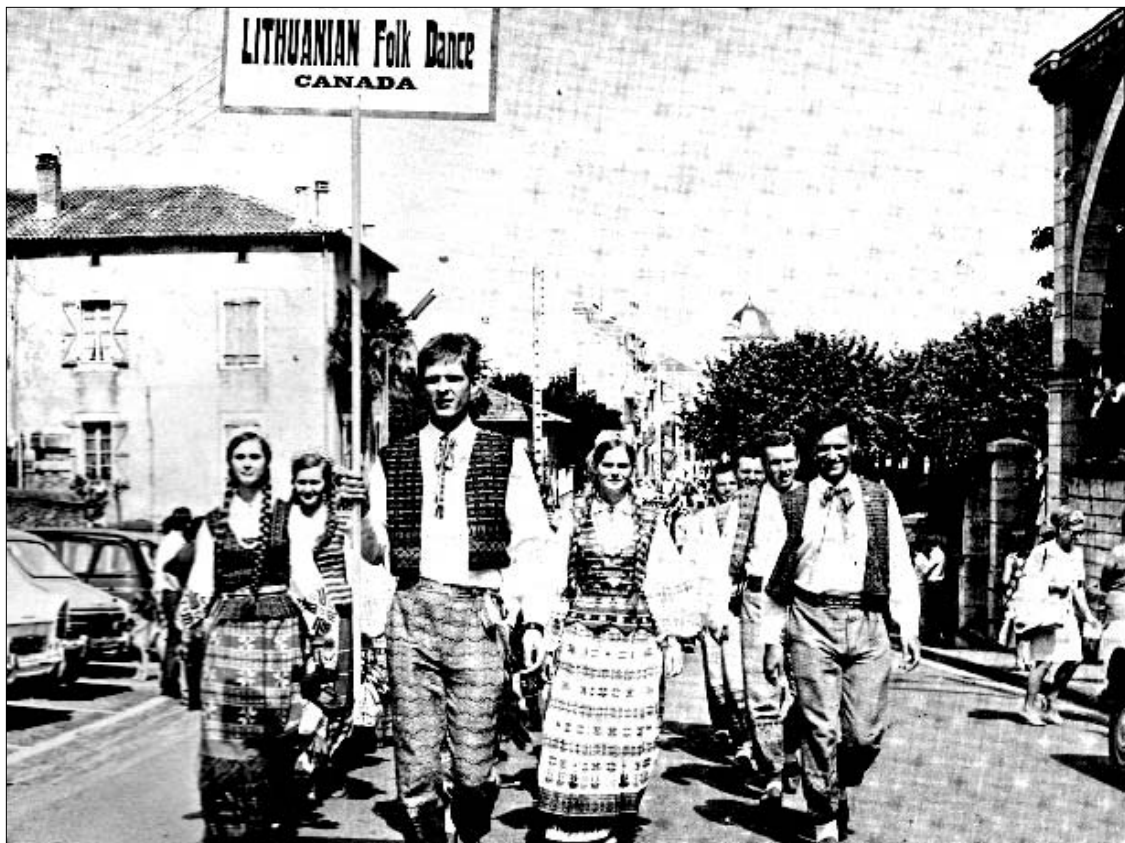
"Gyvataras" žygiuoja Montrėjo miestelio gatve