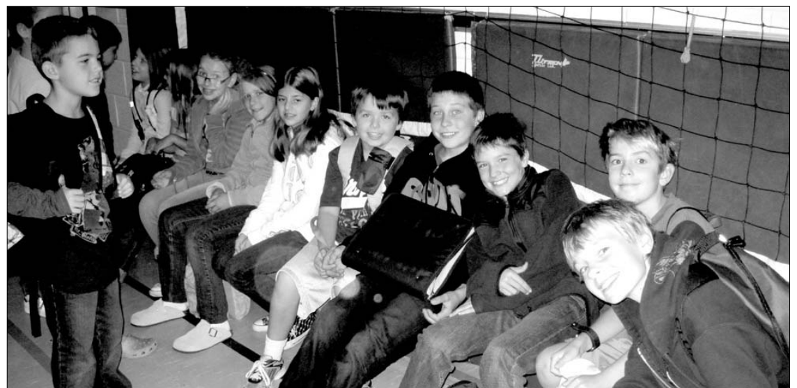
Pirma diena Toronto lietuvių Maironio mokykloje