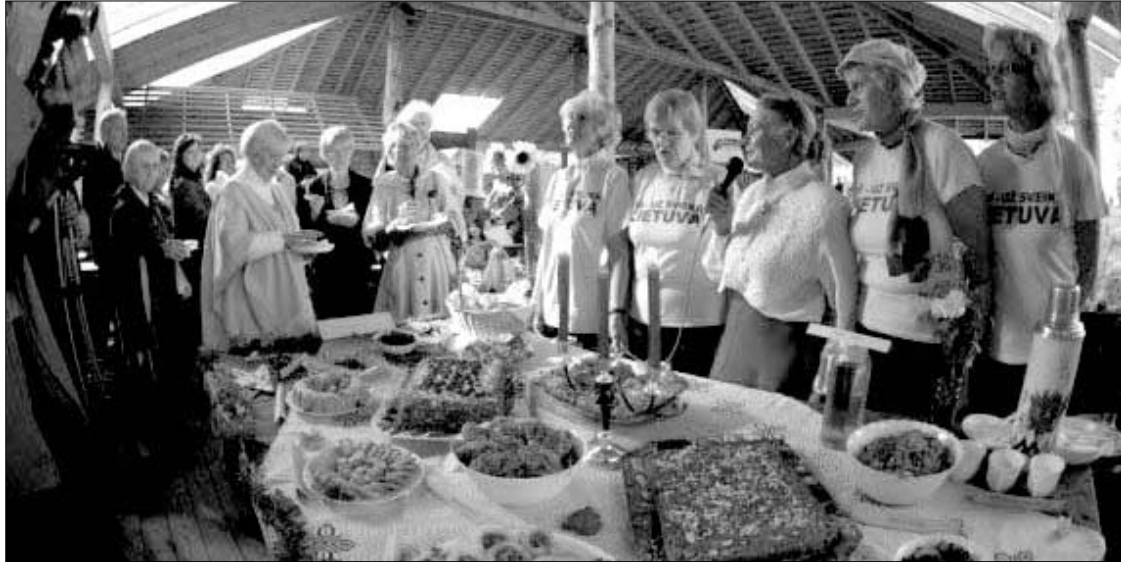
Sveiko maisto ragavimas