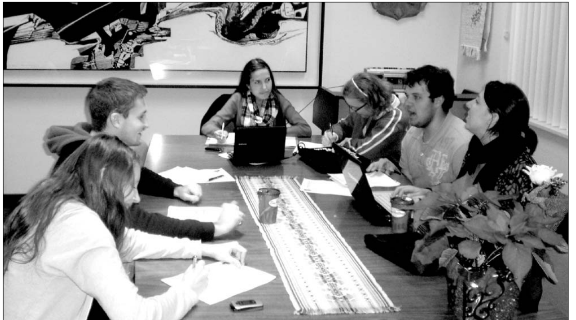
KLJS valdyba planuoja 35-mečio renginį