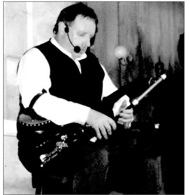
Airiškas dūdmaišis Uilleann pipes

Paskutinį vakarą Dubline praleidome jo priemiestyje, “Taylors Three Rock” kavinėje. Gavome skaniai pavalgyti ir buvome palinksminti airiškų dainų ir šokių programa. Ta programa buvo nieko ypatingo, bet jos metu vienas muzikantas grojo įdo-