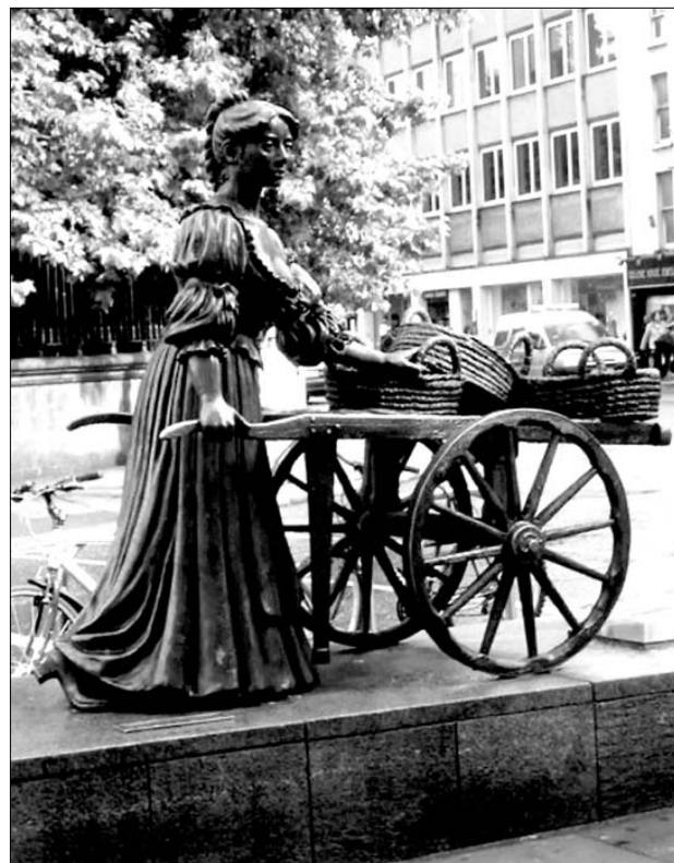
Dublin. Molly Malone