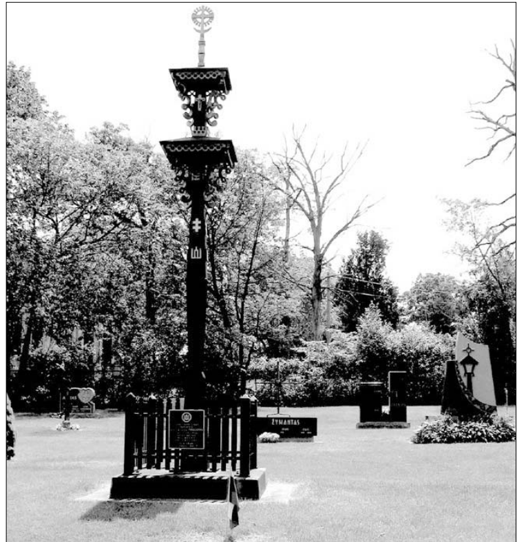
Už Lietuvos laisvę žuvusiems partizanams koplytstulpis Lietuvių tautinėse kapinėse Čikagoje Ntr. E. Sulaičio

Vankuveris (Kanada) pagal Forbes žurnalo apklausą, pavyzdinčiai myli ir saugoja savo aplinką ir klimatą. Šis vakarų Kanados miestas įrašytas antruoju labiausiai besirūpinančių savo aplinka miestų sąrašė. Vankuveryje yra beveik 200 parkų ir aikščių, jie plečiami ir gražiai prižiūrimi. Rūpinamasi ir vandenų bei oro švara. Čia skatinami naudoti natūralūs energijos šaltiniai – saulė, vėjas, vanduo, diegiamos gamtai palankios atliekų perdirbimo technologijos, neteršiantys oro susiekimo būdai. Miestas sėkmingai įgyvendina 100 metų numatytą aplinkos ir klimato apsaugos programą. Pagal Forbes žurnalą, pasaulio švariausiuoju miestu laikoma Malmė (Švedija). Inf.