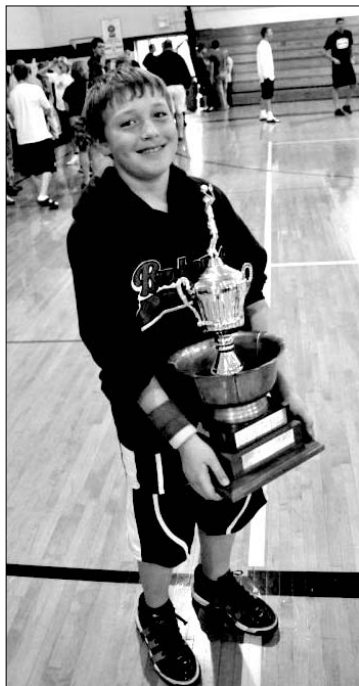
Akimirka iš jubiliejinių ŠALFASS žaidynių 2010 m.

• VTB Vieningosios lygos krepšinio varžybų rungtynes žaidė abi Lietuvos atstovės. Anksčiau pasibaigusiam susitikime B grupėje antrąją vietą užimanti Kauno "Žalgirio" komanda Estijos sostinėje rezultatu 91:66 sutriuškino Talino "Kalevo" komandą ir priartėjo prie baigmės ketverto varžybų. Blogiau pavyko Vilniaus "Lietuvos ryto" klubui. Jie namuose 63:73 nusileido Maskvos CSKA krepšinininkams ir neteko paskutinės vilties patekti į VTB Vieningosios lygos baigmės ketverto varžybas.