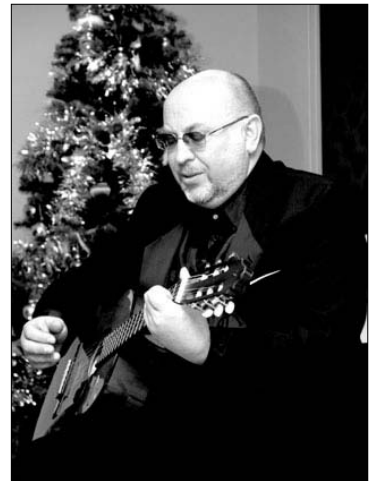
Susitikimo – koncerto Jurbarko rajono Viešvilės vaikų namuose akimirkos