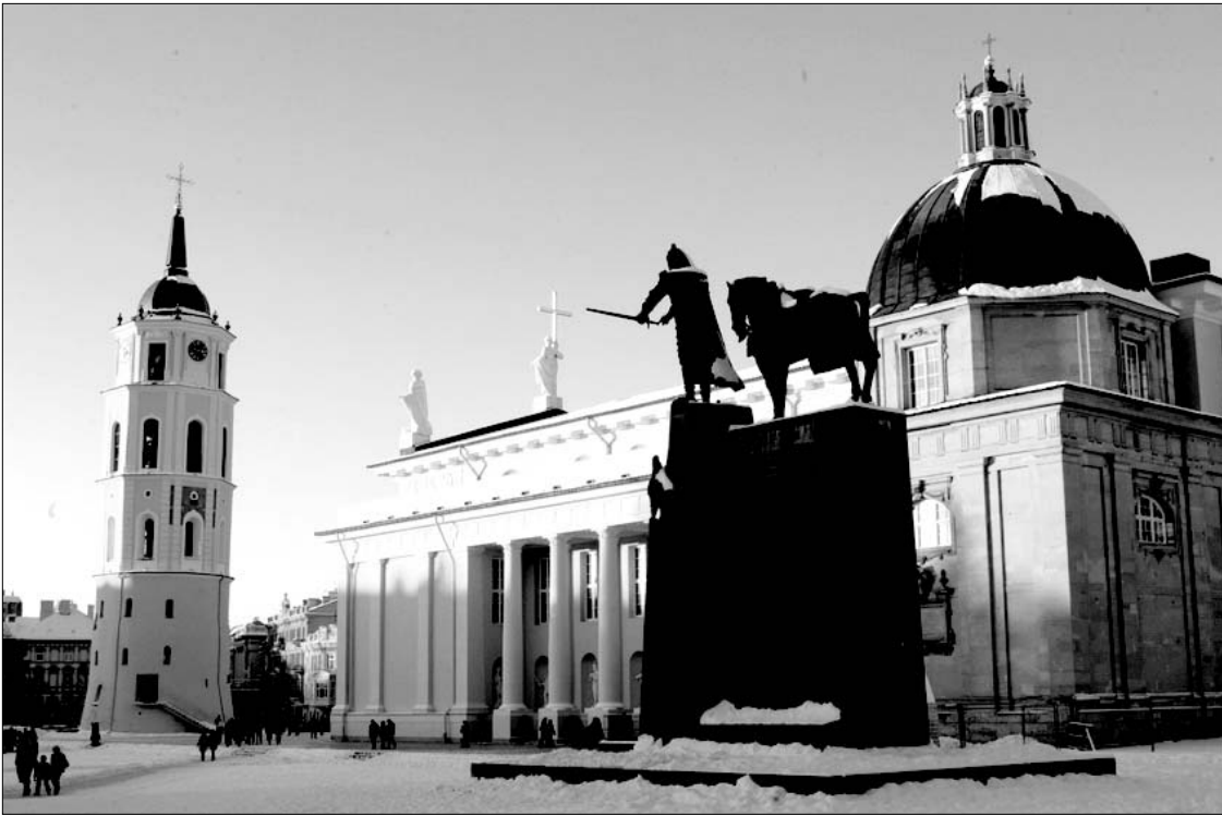
Vilniaus Katedros aikštė – Lietuvos valstybės istorijos atspindys. Klasikinės architektūros statiniai, paminklai išmiesiems Lietuvos valstybės kūrėjams ir svarbioms datoms, virš Gedimino pilies plazdanti trispalvė vėliava svečiams ir Lietuvos gyventojams nuolat primena apie tautos siekius apginti ir išsaugoti valstybingumą, jo simbolį – sostinę Vilnių