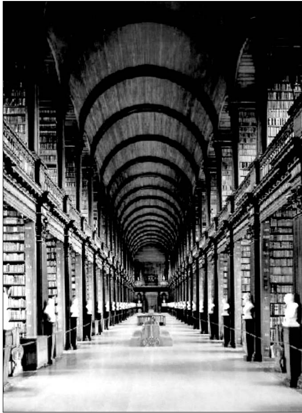
Dublin. Trinity College Senosios bibliotekos Ilgasis kambarys

Mano planas Dubline buvo būtinai aplankyti Trejybės kolegiją, apžiūrėti jos senąją biblioteką ir pamatyti Kells knygą. Taigi, išlipęs iš autobuso ėjau tiesiai pro kolegijos vartus, dairydamasis kelio ženklų į biblioteką.