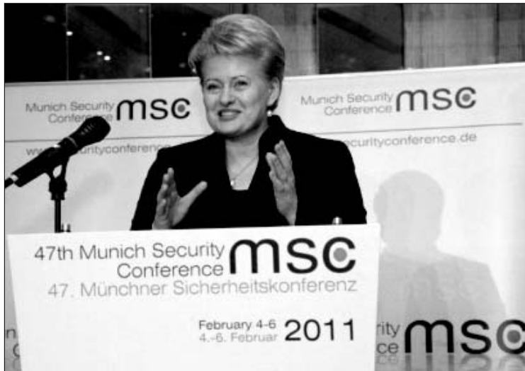
Lietuvos prezidentė D. Grybauskaitė Miuncheno saugumo konferencijoje vakarienės metu pasakė įžanginę kalbą

Lietuvos prezidentė Dalia Grybauskaitė vasario pradžioje dalyvavo Miuncheno saugumo konferencijoje. Šiame 47 kartą rengiamame susitikime buvo svarstoma svarbi tema – plataus masto Euroatlantinio saugumo bendrijos kūrimas. Taip pat buvo aptarta kova su terorizmu, demokratijos plėtra, naujai atsirandančios saugumo grėsmės energijos tiekimo, elektroninių ryšių ir kibernetikos srityse. Lietuvos prezidentė Dalia Grybauskaitė konferencijos atidarymo iškilmingoje vakarienėje pasakė kalbą, kurią palankiai įvertino visi renginio dalyviai.