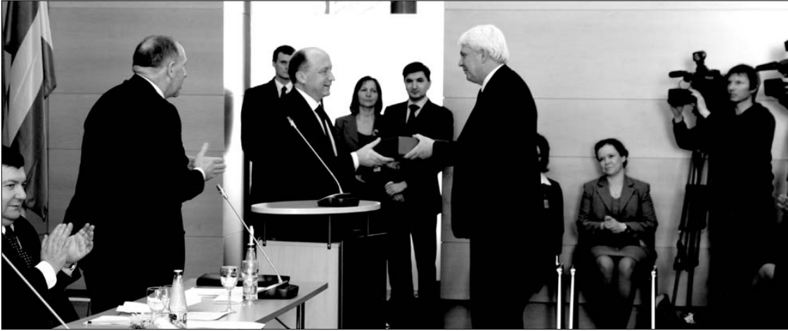
Lietuvos ministeriui pirmininkui A. Kubiliui Švedijos ministeris pirmininkas, lankydamasis Vilniuje, perduoda rašytojo ir diplomato I. Šeinaus archyvų dalį

Ši pavasarį, gegužės 13 d. Lietuvos valstybiniame muziejuje, Naujajame arsenale, pristatyti į Lietuvą sugražinti diplomatų Stasio, Stasio jaunesniojo ir Kazio Lozoraičių bei Igno Jurkūno-Šeinaus archyvai. Dokumentai papildė Lietuvos centrinio valstybės archyvo fondus, atstovybių ir memorialiniai diplomatų daiktai – Lietuvos valstybinio muziejaus rinkinius.