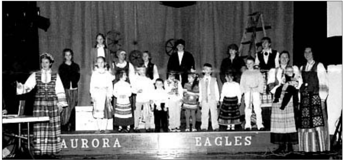
Denver, Colorado (JAV) mokyklos „Vyturėliai“ moksleiviai atlieka Vasario 16-osios programą