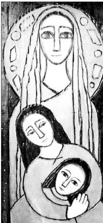
MOTINA (medžio raižinys) Dail. Irena Šimkienė

Salėje išklusėme kunigo Remigijaus aukojamų Mišių už pašauktų amžinybėn Motinų atminimą, meldėme stiprybės ir Dievo palaimos gyvoms mamoms nelengvoje jų kasdienybėje. Į sceną šalia kunigėlio užkopė salės šeimininko vaikaičiai jau pirmokas Da-