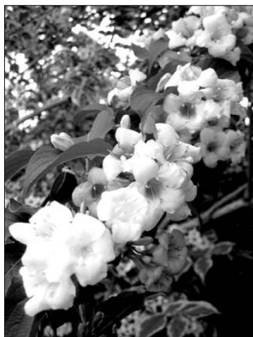
Vasarą atlydi žiedai