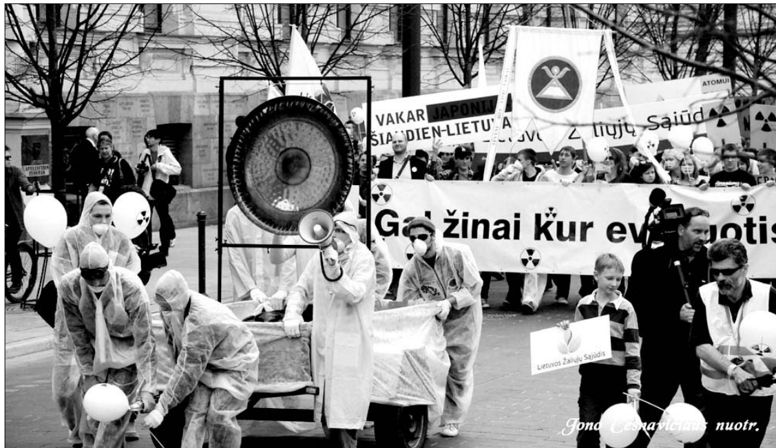
Piketas, įvykęs š.m. balandžio 26 d. Vilniuje dėl atominio elektrinių statybos Lietuvoje ir Gudijoje (50 km nuo Vilniaus). Buvo piketuojama prie LRS. Po to vyko eiseną Gedimino pr. iki Kudirkos a. (Vyriausybės rūmų) Ntr. Jono Česnavičiaus

2010 m. balandžio 26 d. aplinkosaugininkai, žalieji ir susipratę piliečiai iš Lietuvos, Gudijos ir Rusijos surengė piketus prie Gudijos ir Rusijos ambasadų bei prie Lietuvos vyriausybės. Protestai buvo nukreipti prieš Lietuvos teritorijoje bei netoli jos planuojamas statyti 3 atominės elektrines (AE) – Visagine (Lietuvoje), Astrave (Gudijoje, 40 km iki Vilniaus) ir Kaliningrado srityje (Rusijoje, 10-15 km iki Lietuvos sienos). Protesto akcijas vainikavo eitynės Gedimino prospektu nuo Katedros iki V. Kudirkos aikštės. Praėjus beveik metams, sureagavo seimas.