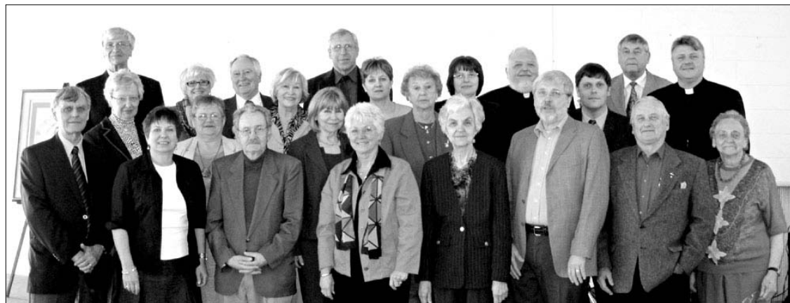
Kanados lietuvių katalikų centro trimetinio suvažiavimo dalyviai