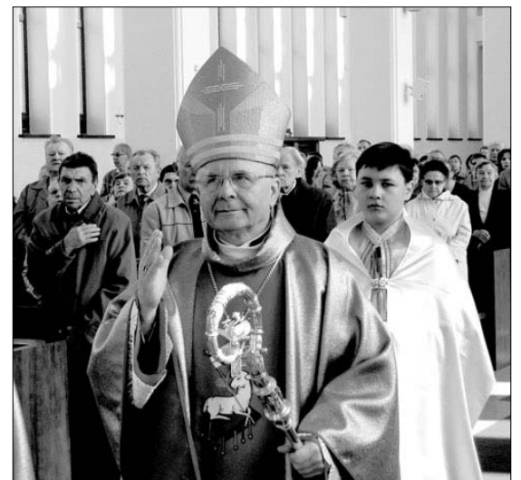
Arkivyskupas Sigitas Tamkevičius Prisikėlimo šventovėje