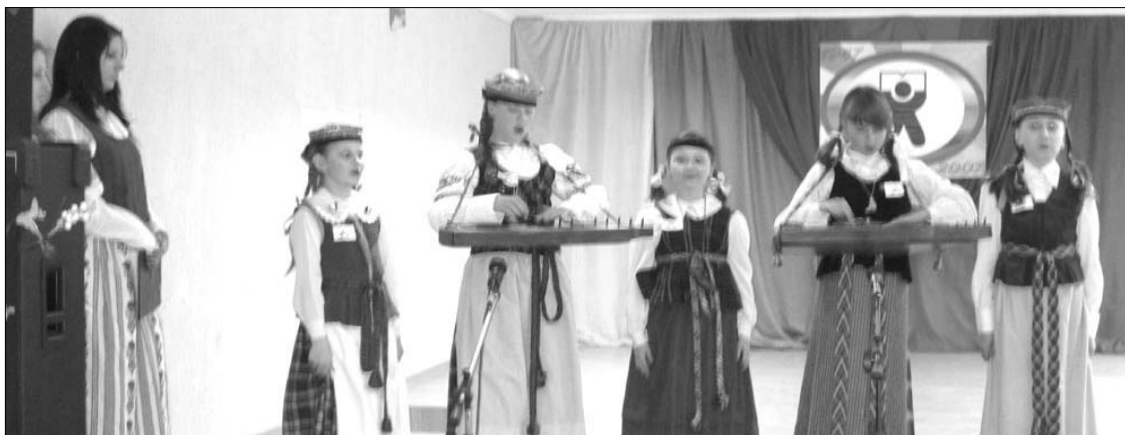
Meninę programą atlieka "Narduvėlė"