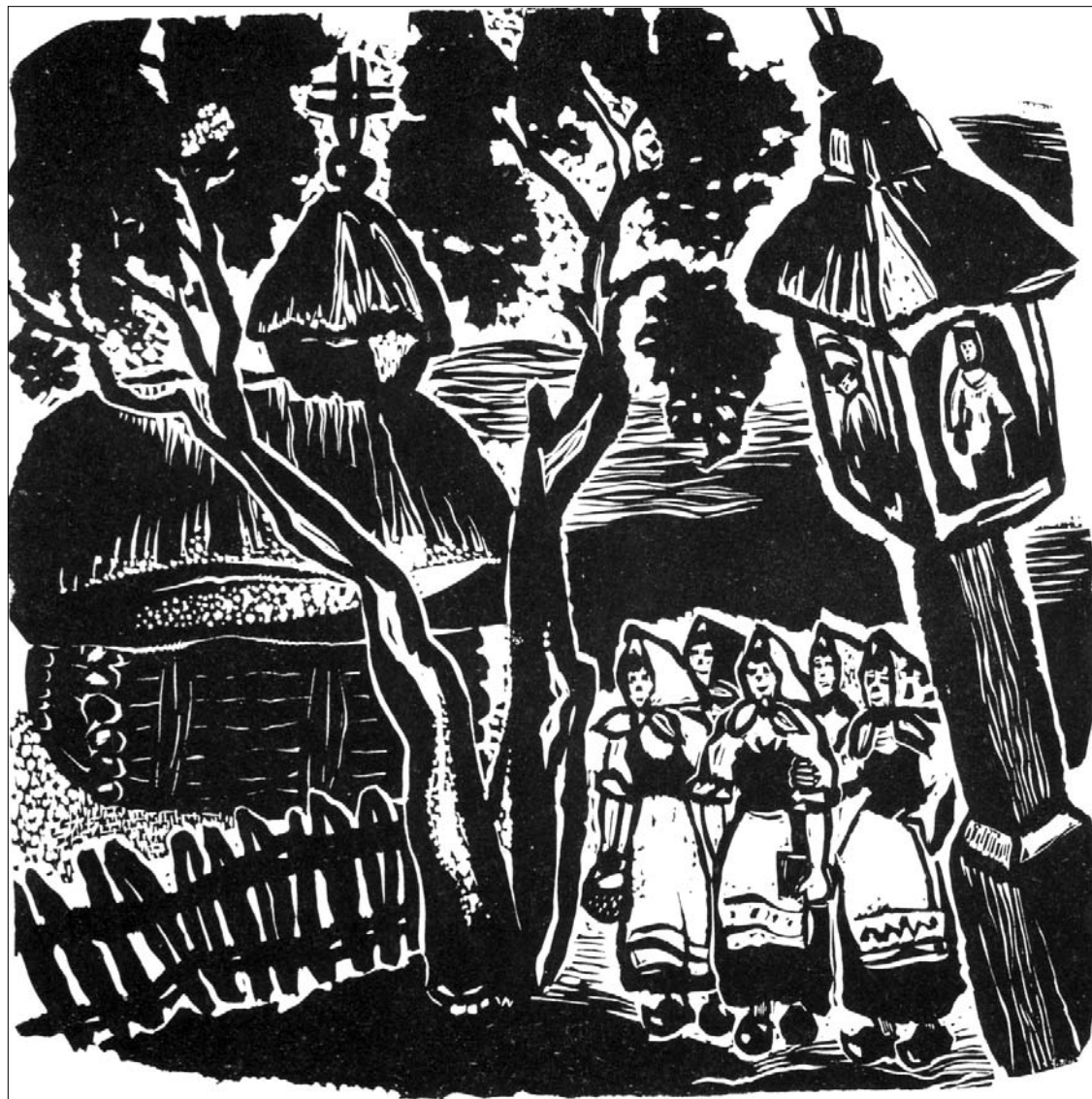
Grįžimas iš atlydų