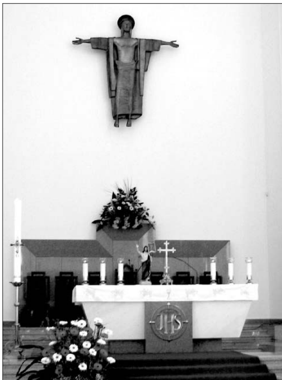
Skulptoriaus Vytauto Kašubos horeljefas "Prisikėlęs Kristus"