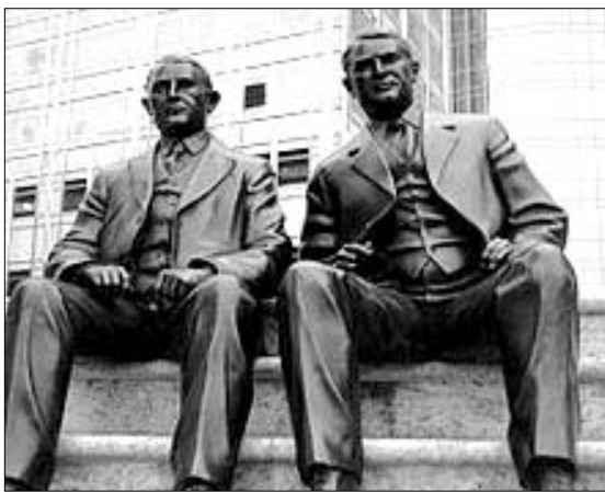
Mayo klinikos steigėjų brolių dr. W. ir dr. Ch. Mayo skulptūra prie ligoninės Rochester, MN

Mayo klinikos, turinčios savo skyrius Rochester (Minnesota), Jacksonville (Florida), Scottsdale-Phoenix (Arizona), garsėja savo patirtimi ir mokslo naujovėmis pagrįstu vėžio ir širdies ligų gydymu, yra viena geriausių pasaulyje. Jos istorija siekia daugiau kaip šimtmetį. Dr. William Mayo, 19 šimtmečio viduryje atvykęs į Ameriką, atidarė privačią gydymo įstaigą. Atjauta ir geru gydymu garsėjęs gydytojas meilę savo profesijai ir nesavanaukiškumą perdavė dviem sūnams dr. William ir dr. Charles Mayo. Paveldėję iš tėvo ir profesiją, ir gydymo įstaigą, abu sūnūs ją plėtė,