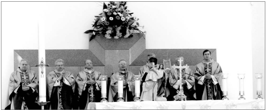
Mišios Prisikėlimo šventovėje Kaune