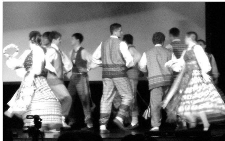
Toronto “Gintaras” šokio sukūryje