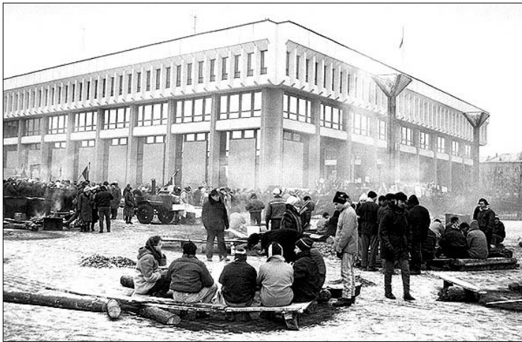
1991 m. sausio 13-toji, Vilnius

Iškilmingam ir tauriam Laisvės gynėjų dienos paminėjimui Valstybinėje operos scenoje buvo pasirinktas čekų muzikos klasiko Antonin Dvorak "Requiem" – vienos iš plačiausiai žinomų koncertinių gedulingųjų Mišių. Šis