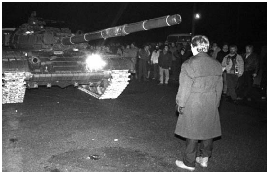
Lietuvoje ir pasaulio lietuvių bendruomenėse paminėta Lietuvos Laisvės gynėjų diena ir 1991 sausio 13-ąją žuvusiųjų atminimas (viršuje ntr. iš archyvo, apačioje – ntr. A Petrulevičiaus). Apie koncertą Vilniuje, skirtą šiai datai, skaitykite 3 psl.