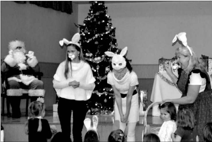
Kalėdinės Zuikių šventės akimirkos