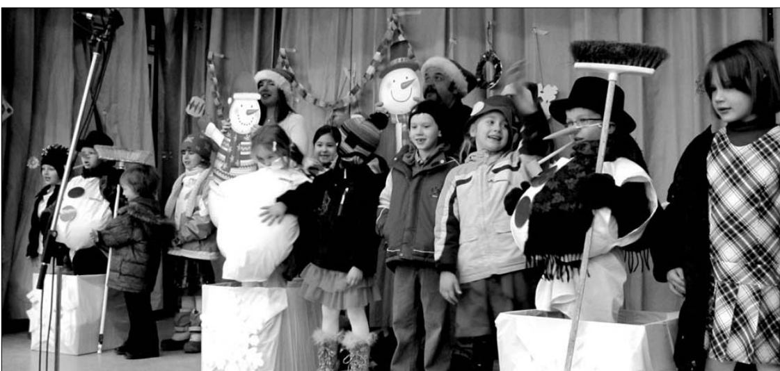
Kalėdinės šventės akimirkos Toronto Maironio mokykloje, įvykusios praėjusių metų gruodžio 15 d. Visi dainavo, kad Kalėdų senelis girdėtų!