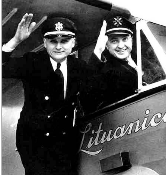
Šiemet sukanka 80 metų nuo legendinio Dariaus ir Girėno skrydžio per Atlantą

Pagal Lietuvos spaudą parengė S. Katkauskaitė