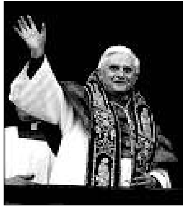
Šv. Tėvas Benediktas XVI

karitatyvinių institucijų darbuotojams tikėti, patirti “susitikimą su Dievu Kristuje – susitikimą, žadinantį jų meilę