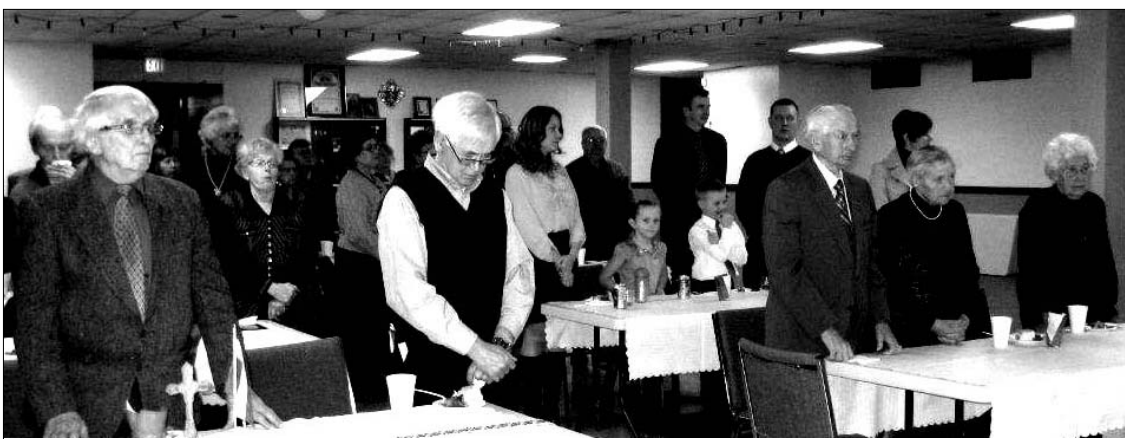
London, ON, lietuviai Lietuvos Nepriklausomybės šventės minėjime š.m. vasario 17 d.