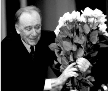
Rusų kompozitorių R. Ščedrino ir Lietuvos muzikinę visuomenę sieja artimi kūrybiniai ryšiai ir bendradarbiavimas