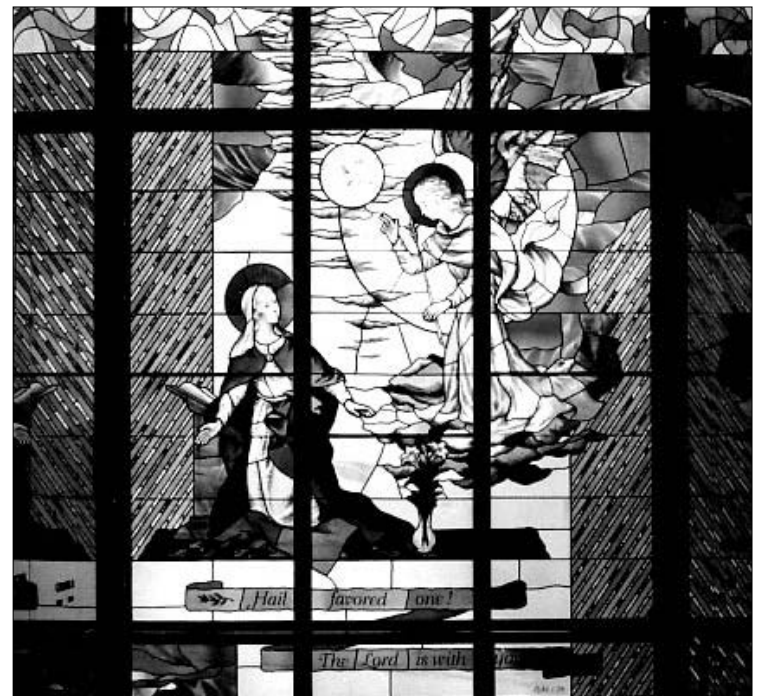
Vitražas “Apreiškimas” Dangaus Vartų mauzoliejuje (dail. Albinas Elskus) E. Hanover, New Jersey

Gal dėl to negirdimas žodis “skaistykla”, nes jo nerandame Šventajame Rašte. Bet tai nuo pradžios krikščionijos gyvavusi tikėjimo tiesa, kuri buvo išnagrinėta tik penkioliktame ir šešioliktame šimtmečiuose. Kadangi sekmadienių Mišių metu kunigai pamokluose paprastai bando pristatyti reikšmę to sekmadienio skaitinių šiandieniniame pasaulyje, tai tas žodis retai paminimas. Vis dėlto apie tą žodį kalbama, kai raginama melstis už numirusius ir kai tikintieji užprašo už mirusius Mišias, kad padėtų tiems, kurie galbūt yra skaistykloje.