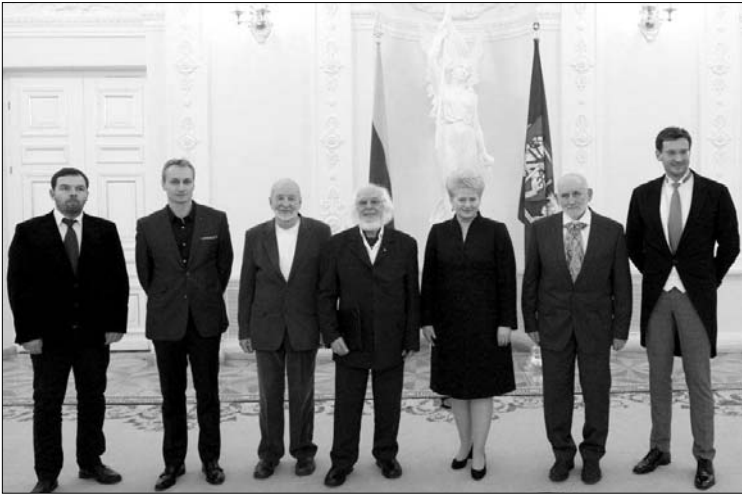
Valstybinės kultūros ir meno premijos buvo iškilmingai įteiktos Prezidentūroje Vasario 16-ąją dieną. Lietuvos prezidentė D. Grybauskaitė su valstybinių premijų laureatais po įteikimo