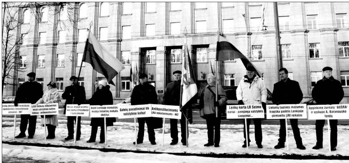
LLKS piketas prie LR užsienio reikalų ministerijos