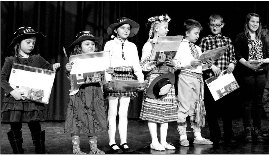
Toronto Maironio mokyklos mokinių rašinių ir piešinių konkurso nugalėtojai, rašę ir piešę tema: “Darius ir Girėnas – Mes skrisime į Lietuvą”