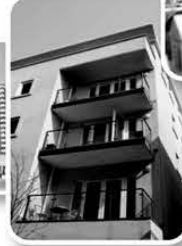
Apartment Buildings Daycare and more