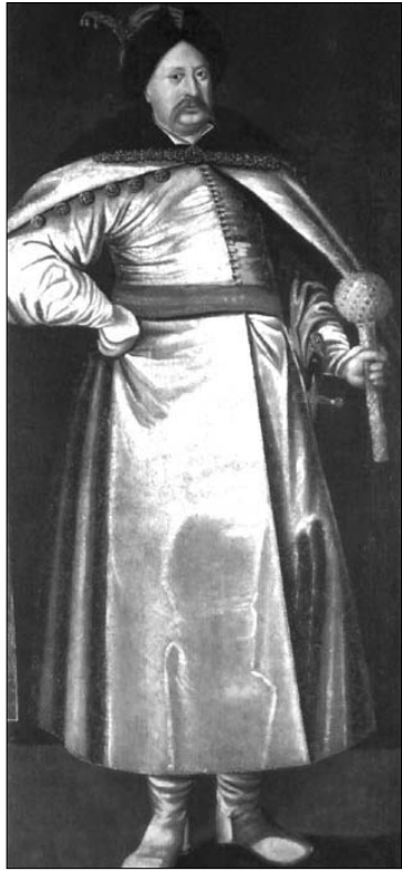
Jonušas Radvila, Lietuvos Didžiosios kunigaikštystės kunigaikštis

Šio regiono susirinkusieji kolektyviai pasirašė 1655 m. rugpjūčio 17 d. sutarties su švedais pirmąjį variantą, o paskui spalio 20 d. Kėdainių