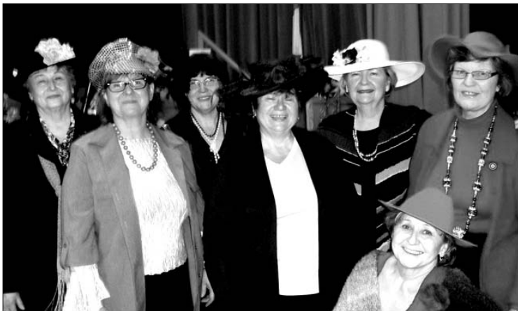
Viršuje: vaikučiai, apdovanoti už įdomius galvos apdangalus; apačioje – puošnios blynų balius dalyvės

Vos nurimus viduržemio pūgai, vasario 12 d. hamiltoniečiai skubėjo į tradicinį Užgavėnių blynų balių, kurį, kaip ir kasmet, ruošė KLKM dr-jos skyriaus valdyba. Šį kartą žmonės atvykti buvo kviečiami pasipuošę įdomiais galvos apdangalais, ir tai iš tiesų suteikė šventei naują spalvą. Visi "skrybėlėtieji" ir "kepurėtieji" gavo po papildomą loterijos bilietą, prie