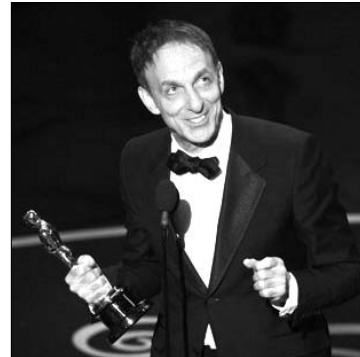
Oskaru apdovanojamas Kanados kompozitorius Mychael Danna už muziką kino filmui Life of Pi

Tradiciniame JAV Kino akademijos apdovanojimų sąraše šiemet buvo ir dviejų kanadiečių pavardės. Kanados kompozitorius Mychael Danna buvo apdovanotas Oskaro