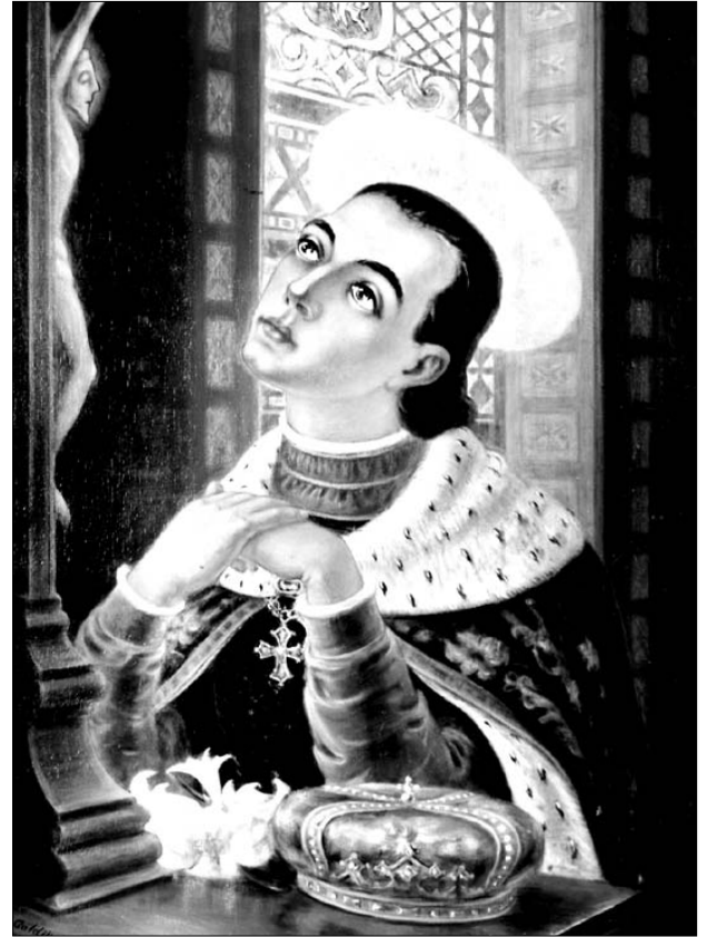
ŠV. KAZIMIERAS (dail. Adomas Galdikas) Lietuvių pranciškonų koplyčios didžiajame altoriuje, Brooklyn, NY

Tikėjimas – dovana ir atsakas – leidžia mums pažinti Kristų kaip įsikūnijusią ir nukryžiuotą Meilę, visišką ir tobulą klusnumą Tėvo valiai ir begalinį dieviškąjį gailingumą artimui; tikėjimas išaknydina širdyje ir prote tvirtą įsitikinimą, kad ta Meilė yra vienintelė tikrovė, nugalinti blogį ir mirtį. Tikėjimas kviečia žvelgti į ateitį su vilties dorybe, kupiniems pasitikėjimo laukti Kristaus meilės pergalės pilnatvės. Savo ruožtu meilė leidžia mums įžengti į Kristuje parodytą Dievo meilę, asmeniškai ir egzistenciškai prisidėti prie Kristaus visiško ir besąlygiško savęs dovanojimo Tėvui ir broliams. Pripildydama meilės, Šventoji Dvasia įgalina mus