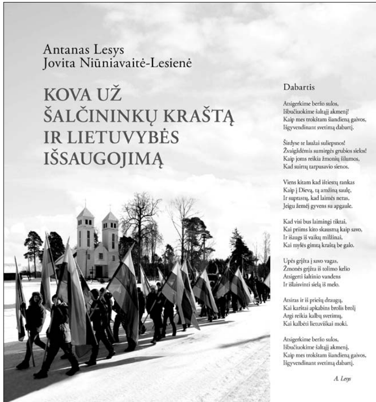
Knygos Kova už Šalčininkų kraštą ir Lietuvos valstybės išsaugojimą viršelis