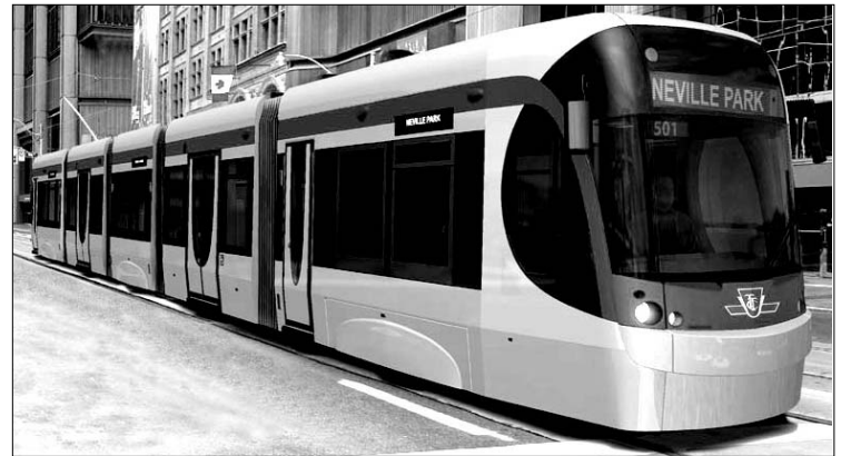
Bandomas naujasis tramvajus Toronto gatvėse

Toronto gatvėse bandomi naujo modelio tramvajai. Juos sukūrė ir pagamino Montrealyje esanti Bombardier verslovė. Jau kitais metais gatvėse turėtų pasirodyti 204 naujieji tramvajai. Jie yra trečdaliu ilgesni nei senieji, su žemesnėmis grindimis, tyliau važiuoja, turi oro vėsinimo įrangą. Naujajame modelyje telpa daugiau keleivių. Naujieji tramvajai, kainavę $1.2 bln. kitąmet visiškai pakeis pustrėčio šimto susidėvėjusių, dažnai gendančių tramvajų, kurie tarnauja miesto gyventojams nuo 1970-80 metų.