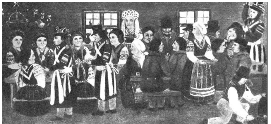
Donelaičio projektui: Mažosios Lietuvos drabužių apdarai iš XVII š.