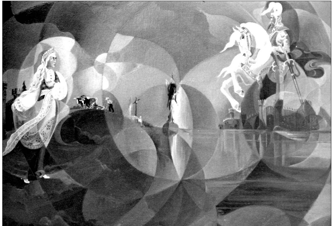
MANO TĖVŲ ŽEMĖ (aliejus)