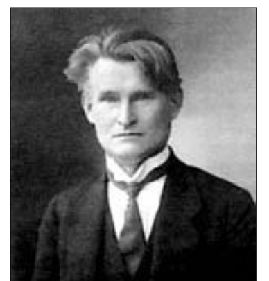
Prezidentas Kazys Grinius

Gruodžio 17 dieną turėjo įvykti Prezidento Kazio Griniaus 60-jų gimimo metinių minėjimas Prezidentūroje. Tuo tikslu į Kauną buvo sukviesti visų kariuomenės divizijų ir pulkų vadai bei įstaiigų viršininkai. Visi jie buvo surinkti į bendrą posėdį, kuriame buvo