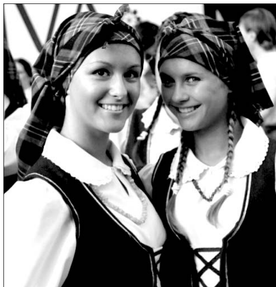
Lietuvaitės tautiniais drabužiais

Mūsų kalba – unikali, seniausia iš gyvųjų keturių šimtų trisdešimt devynių indoeuropie-