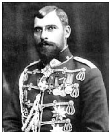
Lietuvos kariuomenės generolas Povilas Plechavičius

Nuo 1921 metų P. Plechavičius tapo pulko vadu. Su ka-