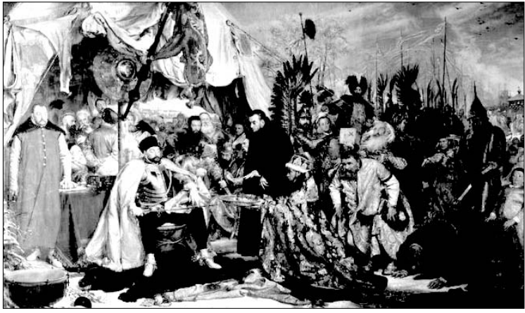
Į Raudondvarį sugrįžo tik J. Matejko paveikslo Steponas Batoras prie Pskovo kopija