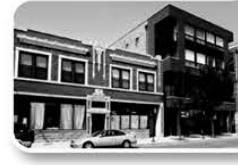
Small Business Rental Properties

Providing commercial property mortgages for our community