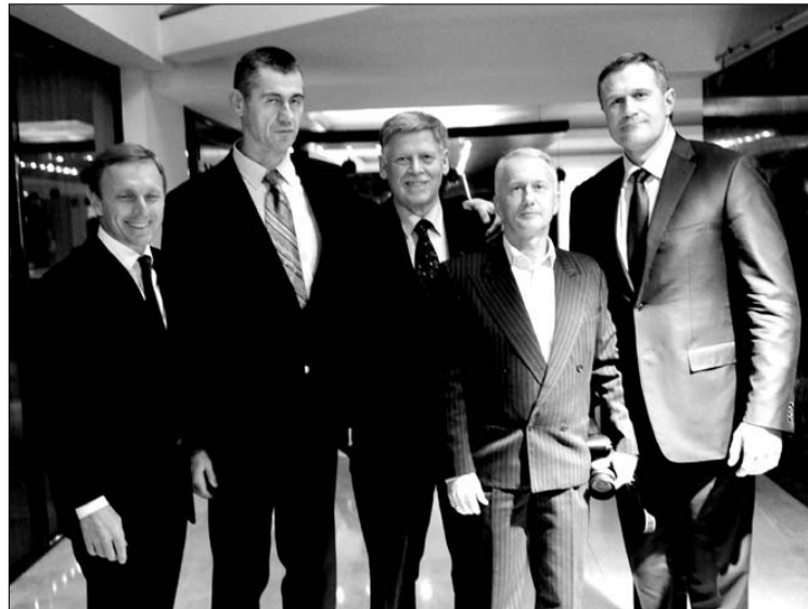
Lengvosios atletikos žvaigždės

tale "Alfa.lt". Per mėnesį internetui šiuo klausimu atidavė daugiau nei 15,000 balsų. Taigi, šiuos sportininkus tikrai drąsiai galima vadinti geriausiais ir vienais populiariausių