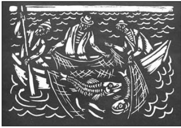
Vyt. Kasiulio paveikslas Žvejai (lino raiziny)

Parodoje „Pasaulio lietuviai Paryžiuje / XX š. antroji pusė“ galima susipažinti su dailininkų kūrybos darbų rinkiniu, kurį parodai Kaune pa-