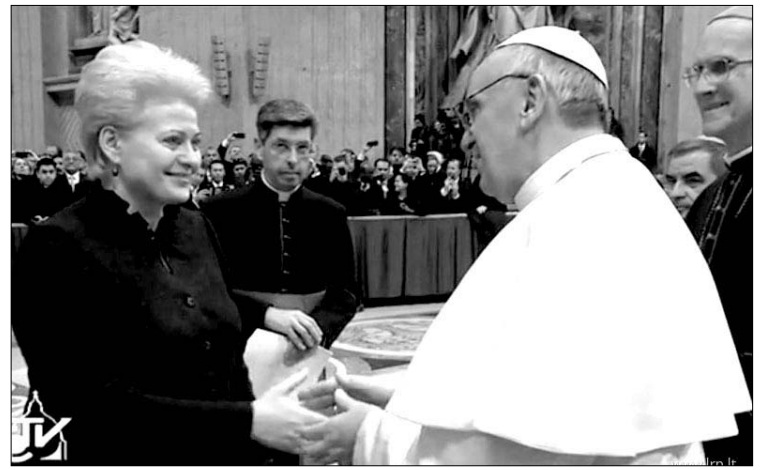
Lietuvos prezidentė Dalia Grybauskaitė dalyvavo naujojo popiežiaus Pranciškaus išventinimo iškilmėse Romoje, Vatikane. Ji Lietuvos žmonių vardu pasveikino Šventąjį Tėvą ir padovanojo jam trispalvę verbą, surištą pagal Vilnijos tradicijas. Naujajam katalikų dvasiniam vadovui Prezidentė palinkėjo stiprybės, išminties ir valios nelengvame, bet kilniame darbe, pakvietė apsilankyti Lietuvoje jam patogiu laiku