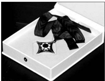
Svarbiausias Lietuvos teatro apdovanojimas „Aukštinis scenos kryžius“

Tarptautinės teatro dienos proga Lietuvos teatrų aktoriams ir spektaklių kūrėjams išdalinti apdovanojimai už geriausius praėjusių metų