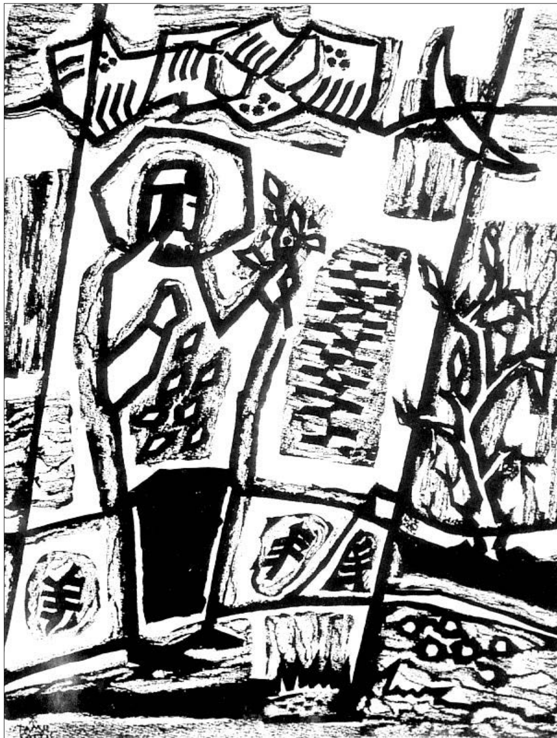
Laimingas pavasaris (litografija)