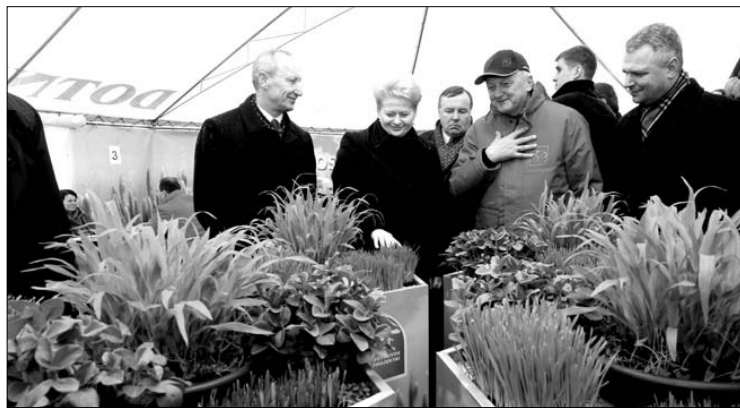
Lietuvos prezidentė D. Grybauskaitė žemės ūkio parodoje “Ką pasėsi...”

galima naudoti ne tik žemės ūkyje, bet ir aplinkosaugoje, maisto pramonėje. Visai Europai pergyvenant sudėtingą laikotarpį, Lietuvai žemės ūkiui iš ES biudžeto 2014-2020 metams pavyko išsiderėti trečdaliu daugiau lėšų – beveik 18 milijardų litų. Tiesioginėms išmokoms skiriama 11.2 milijardo litų – tai 75% daugiau nei 2007-2013 metais. Taip pat apie 5.54 milijardo litų bus skirta kaimo plėtrai. Prezidentės teigimu, že-