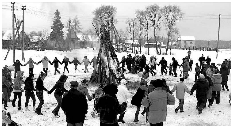
Užgavėnių šventė Lietuvoje

Per gamtos grožiu nenuskriaustus laukus ir kiemus skambėjo nuotaikingos vaikiškos dainos: Blynai, skaniausi blynai, / Išėjo tėvelis į mišką, / Jurgeli, meistrelī, / Viens du trys, / Mes čigonai Lietuvos, / Tumbala tumbalalaika, / Rimdžiūnuos gyvena nykštukas kepėjas, / A a liūli, aisim pas Paliulį, / Šarkos varnos ir kt. Užgavėnės – viena spalvingiausių lietuvių liaudies švenčių, kuriose ypač daug humoro,