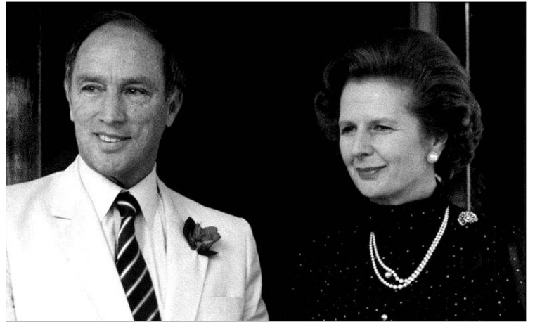
1981 m. Londonas. Tuometinė D. Britanijos ministrė pirmininkė M. Thatcher ir Kanados liberalų vyriausybės vadovas Pierre Trudeau

Kanados dabartiniai ir buvę vyriausybės vadovai S. Harper, J. Chretien, B. Mulroney išreiškė užuojautą dėl Margaret Thatcher, 87, mirties artimiesiems ir D. Britanijos visuomenei. Kaip svarbią palikimo dalį jie įvertino šios politikės išmintį ir nuoseklius veiksmus ginant konservatizmo principus, stiprinant D. Britanijos ekonomiką, įtaką pasaulyje ir tarptautinėje politikoje.