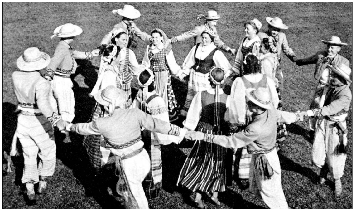
Su linkėjimais šiemet vykstantiems į Lietuvą: “Tai bus linksma, tai bus linksma Lietuvoj”...