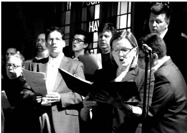
Akimirkos iš JAV lietuvių katalikų sielovados IV konferencijos Lemonte