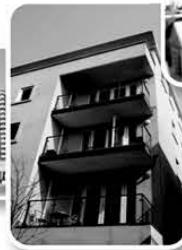
Apartment Buildings Daycare and more