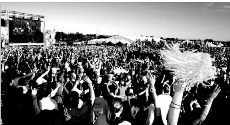
The Weekend to End Cancer

– Every 8 minutes, someone in Canada is hearing those dreaded words: you have cancer. At Princess Margaret Cancer Centre, our passion, mission and vision is to conquer cancer in our lifetime. We are one of the top 5 cancer research centers in the world and home to over 1,000 researchers who spend every