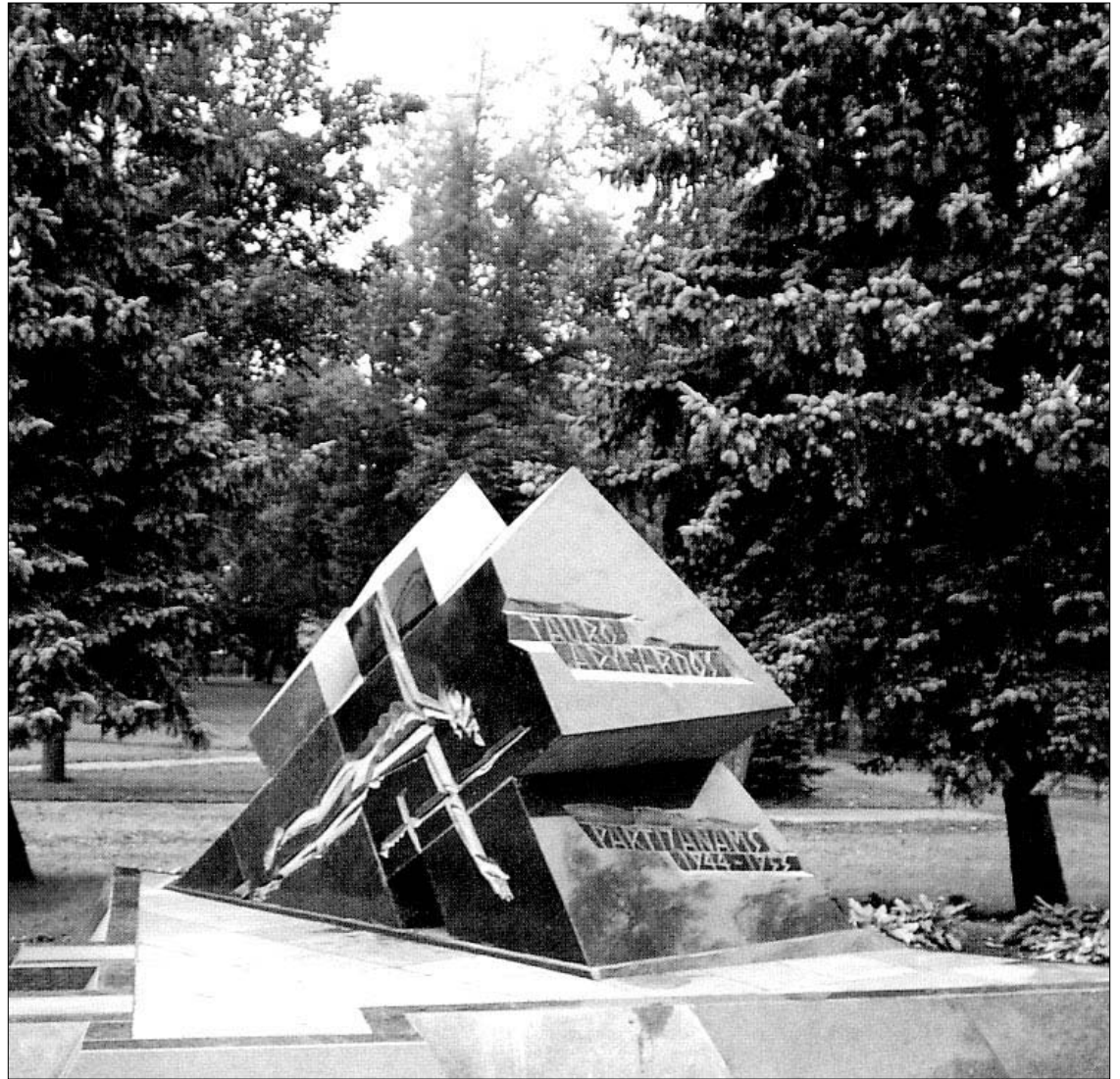
Paminklas Tauro apygardos partizanams, ryšininkams ir rėmėjams atminti Marijampolės Vytauto parke (Ntr. iš knygos Pietų Lietuvos partizanų sritis )