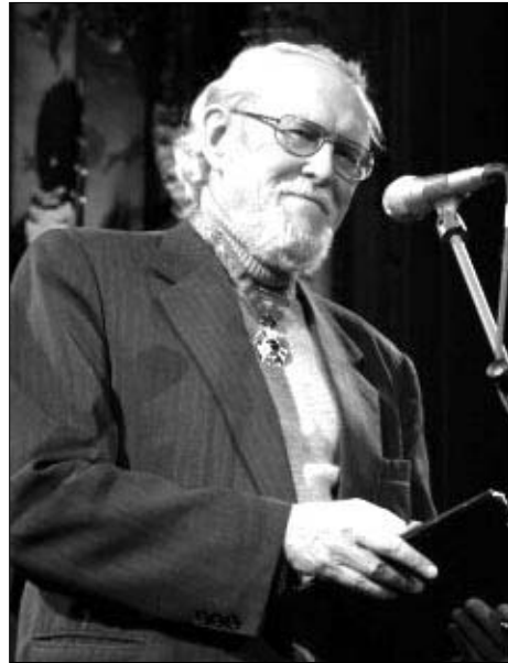
Poetas Marcelijus Martinaitis

lieptais (1966), Saulės grąža (1969) M. Martinaitis pasirodė kaip naujesnės, labiau šiuolaikiškos poezijos kūrėjas. M. Martinaitis kūrybos sąrašas turtin gas ir įvairus – keliolika poezijos rinki-