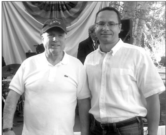
JAV senatorius John McCain ir Lietuvos ambasadorius JAV Žygmantas Pavilionis

JAV senatoriaus John McCain kvietimu metiniame Sedonos forume balandžio 26-27 d.d. kartu su JAV viceprezidentu Joseph Biden, įtakingais respublikonų ir demokratų partijų atstovais bei valstybių vadovais dalyva-