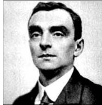
Oskaras Milašius, poetas, filosofas

pavyks pavergti Kauną ir Ukmergę; galvojo tik tada, kai bus užkariauta visa Lietuva, jiems pavyks pavergti ir Aistuvą.