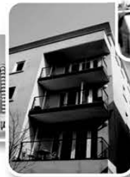
Apartment Buildings Daycare and more