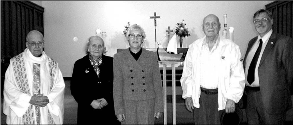
Tikėjimo metų kryžiaus dalies apsilankymas Sudbury balandžio 27 d.