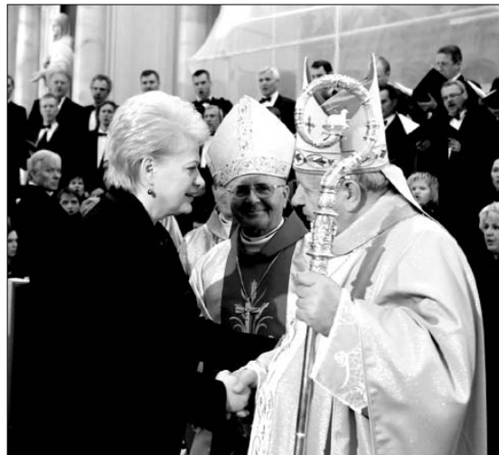
Lietuvos prezidentė Dalia Grybauskaitė sveikina jubiliejinį Mišių garbingą svečią popiežiaus pasiuntinį kardinolą St. Dziwisz