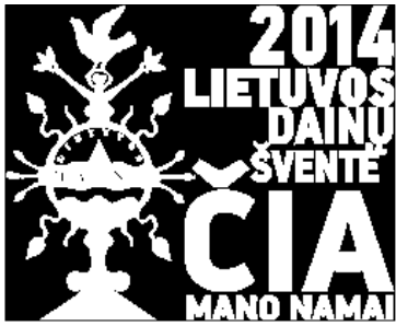
2014 m. vykiančios Lietuvos dainų šventės logo

Simbolinė įžanga į 2014 m. Dainų šventę – birželio 28 d. Kaune vykiantis renginys, skirtas šventės 90-mečiui paminėti. Pirmoji Dainų šventė Lietuvoje surengta 1924 m. Nuo 2011 m. prasidėjusius darbus šiemet vainikuos 4 regioninės šventės – Kaune rinksis moksleivių chorai, Zarasuose – suaugusiųjų chorai, Marijampolėje – šokių kolektyvai, Švenčionyse – dainų ir