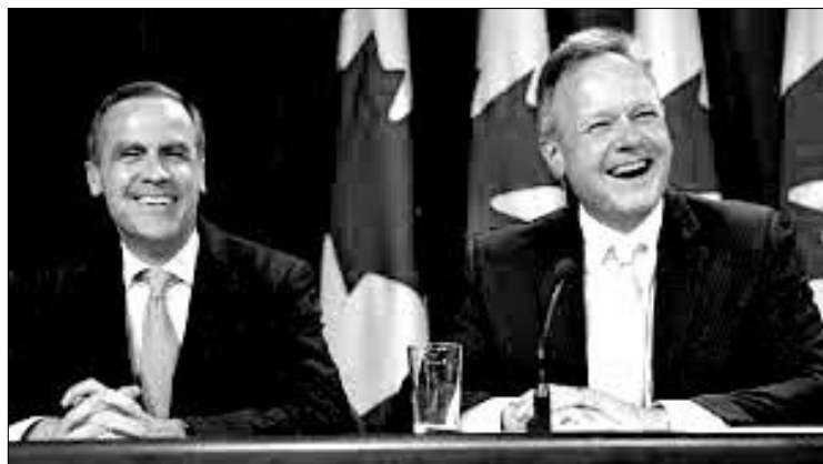
Kanados Centrinio banko valdytojai: buvęs M. Carney (k.) ir naujasis St. Poloz

Kanados centrinio banko valdytoju paskirtas Stephen Poloz, 57, buvęs Kanados Eksperto plėtros agentūros prezidentas. Nuo birželio 3 d. jis pakeis Mark Carney, kuris pakviestas dirbti Bank of England (D. Britanija) valdytoju. M. Carney – pirmasis užsienietis, kuriam patikėta vadovauti svarbiausiai D. Britanijos finansinei įstaigai.