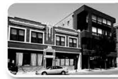
Small Business Rental Properties