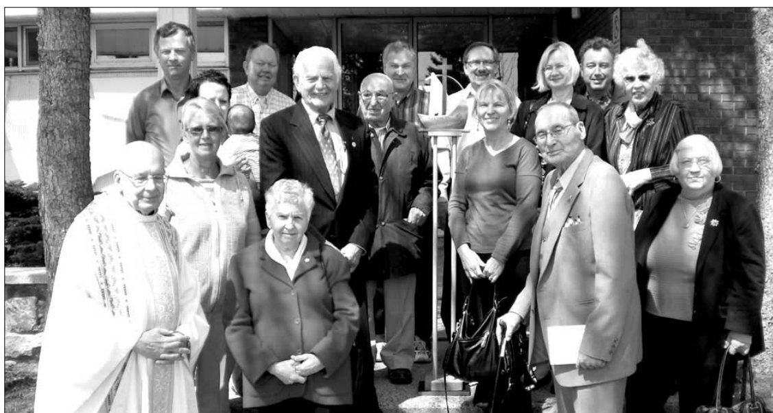
Tikėjimo metų kryžiaus dalies apsilankymas Sault Ste Marie balandžio 28 d.