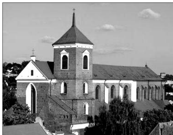
Šv. Apaštalų Petro ir Povilo arkikatedra bazilika