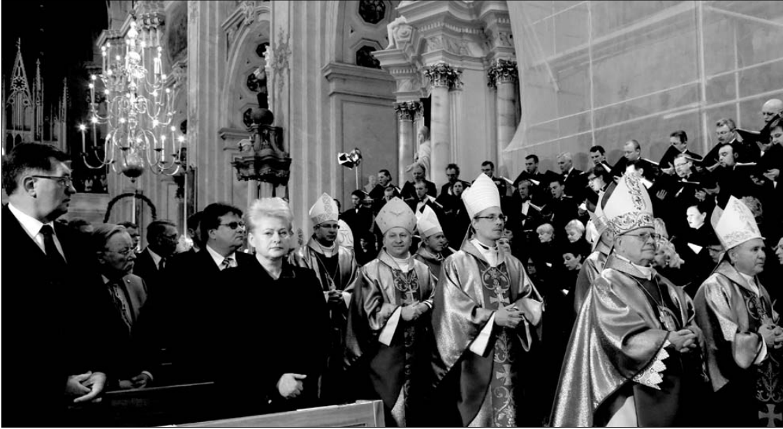
Iškilmingos jubiliejinės Mišios Kauno arkikatedroje, kuriose dalyvavo Lietuvos prezidentė Dalia Grybauskaitė, ministeris pirmininkas A. Butkevičius, Europos parlamento narys Vyt. Landsbergis ir kiti Lietuvos pareigūnai

Lietuvos respublikos prezidentė Dalia Grybauskaitė lankėsi Kaune, kur Šv. Apaštalų Petro ir Povilo arkikatedroje bazilikoje dalyvavo Mišiose, skirtose arkikatedros 600 metų jubiliejui ir palaimintojo Jono Pauliaus II apsilankymo 20-mečiui paminėti.