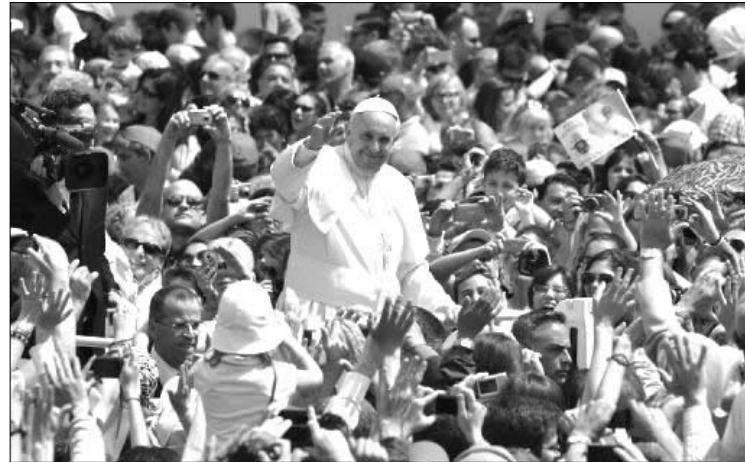
Naujasis popiežius Pranciškus sveikina maldininkus š.m. gegužės 12 d. Šv. Petro aikštėje, Vatikane

būdas gali atkreipti jaunimo dėmesį. Kalbama apie peteliškės efektą, kur sparnelių suplasnojimas gali nubanguoti per visą pasaulį. Po dabartinio popiežiaus išrinkimo kad ir mažiausi gestai, ateina iš Vatikano valstybės, nuskamba, tarsi nubanguoja, po visą pasaulį. Popiežiaus pirmieji žingsniai – atsižadėjimas auk-