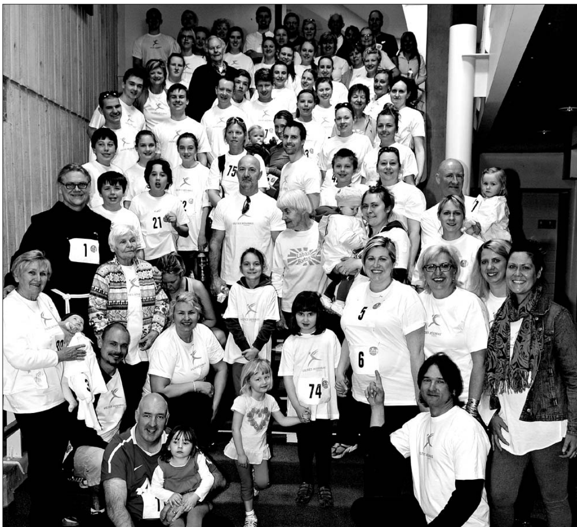
Būrys „Vilties bėgimo“ dalyvių Toronte, ėjusių, bėgusių š.m. balandžio 28 d. ir šitaip parėmusių statomą Šv. Pranciškaus onkologijos centrą Klaipėdoje (plačiau kt. TŽ nr.)

Taiigi, laukiame Jūsų kūrybos, Jūsų laiškų ir linkime sėkmės gyvenime ir kūryboje.