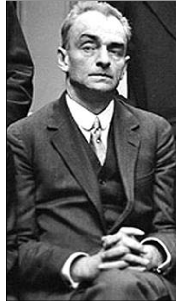
Oskaras Milašius, poetas, filosofas

vienas prie kito kelius: "lietuviškąjį mistiškąjį dvasios žavingumą", kurio jis visur ieškojo ir ilgėjosi, kaip "ištroškęs keleivis vandens" ir ypatingą lietuvišką katalikybę, kai "tauta niekieno neraginama, dažniausiai svetimtaučių klaidi-