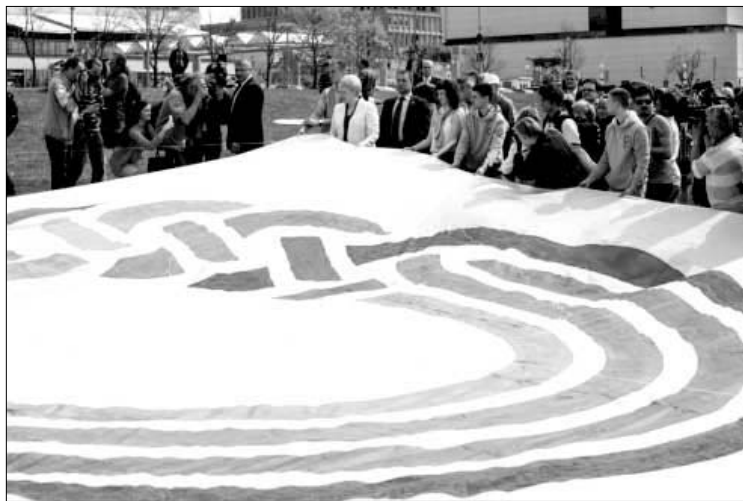
Į padangę skraidinamas aitvaras su Lietuvos pirmininkavimo ES ženklu

Šis ženklas, vaizduojantis ratą ir pyne su Lietuvos vėliavos spalvomis, kalba apie vieningą Europos sąjungą, valstybių bendradarbiavimą ir sugebėjimą kartu įveikti visus kylančius iššūkius. Simbolinio piešinio spalvos primena Lietuvos ryšius su Baltijos jūros ir Šiaurės Europos regionu, o