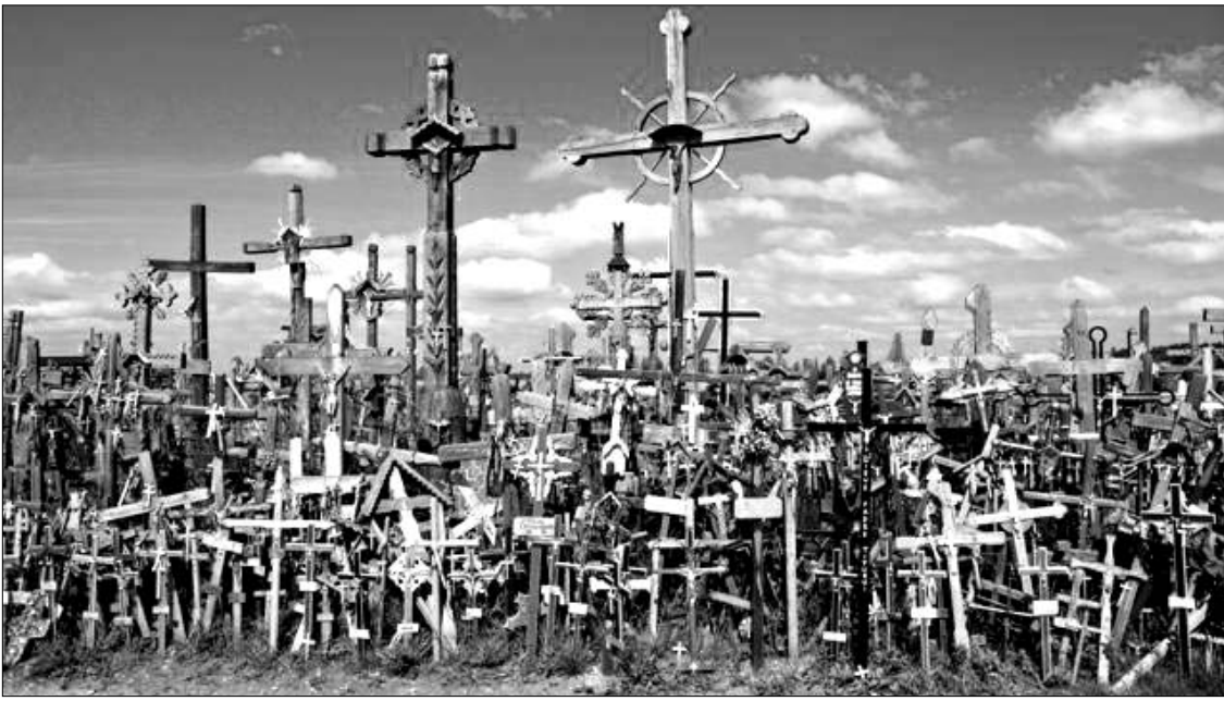
Žvilgsnis į Kryžių kalną prie Šiaulių Lietuvoje