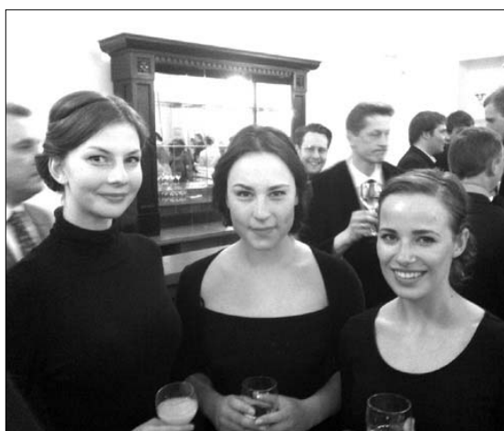
LMTA studentės džiaugiasi švente