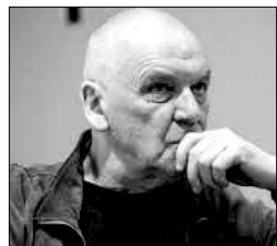
Teatro režisierius Eimuntas Nekrošius

E. Nekrošius – pirmasis lietuvių teatro veikėjas, kuriam suteiktas akademinis garbės daktaro vardas. Reikšmingiausi kriterijai – jo režisierinis talentas, neeiliniai pasiekimai Lietuvos teatro raidai ir Lietuvos vardo garsinimas visame pasaulyje.