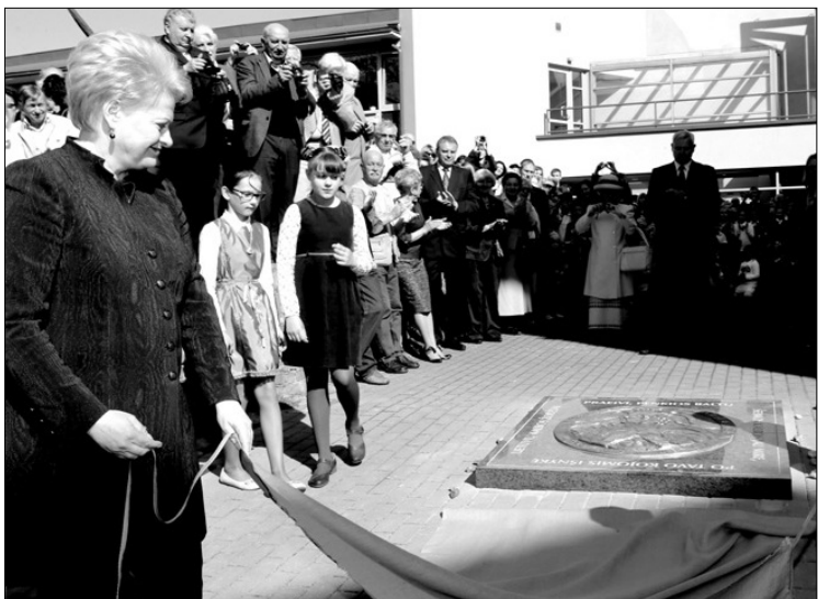
Klaipėdoje viešosios I. Simonaitytės bibliotekos kiemelyje atidengtas paminklas lietuvių kalbai – pirmasis Lietuvoje. Kairėje – Lietuvos prezidentė D. Grybauskaitė

Klaipėdos apskrities viešosios I. Simonaitytės bibliotekos Saulės laikrodžio kiemelyje atidengtas paminklas kalbai. Tai į granito plokštę įmontuotas bronzinis bareljefas su užrašu: „Praeivi, penkios baltų šeimos kalbos jau mirė, po tavo kojomis išnykė lietuvių kalbos žodžiai. Atmink ir gerbk savo kalbą“.