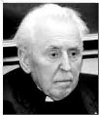
mons. Alfonsas Svarinskas

Mūsų dienų gyvenimo patirtis liudija, kad ekonominis ir dvasinis gyvenimas eina žemyn.