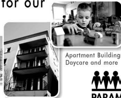
Apartment Buildings Daycare and more