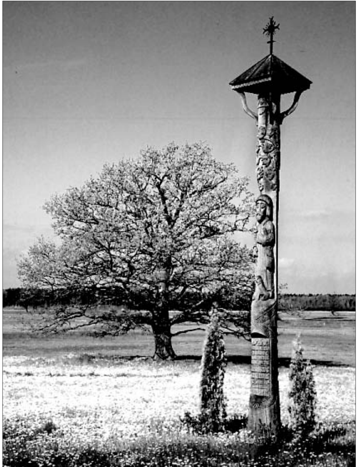
Pavasaris Stebeikėlių apylinkėje (Pasvalio rajonas), kurioje yra gimęs poetas Bernardas Brazdionis

Anapilio korporacijos metinis susirinkimas – 10 psl.