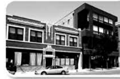
Small Business Rental Properties

Providing commercial property mortgages for our community