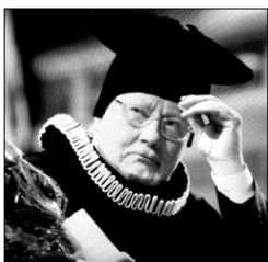
Prof. Vytautas Landsbergis

Balandžio 25-osios vakaras buvo ypatingas ne tik pavasariško oro atšilimu Vilniuje, bet ir tuo, kad Lietuvos valstybinėje filharmonijoje vyko ypatingas renginys. Tą vakarą Lietuvos muzikos ir teatro akademija (LMTA) su būrė kvistinius svečius į 80-ojo jubiliejaus iškilmes, kurių metu buvo pristatyti, pagerbti du garbės daktarai – muzikologas prof. Vytautas Landsbergis ir teatro režisierius Eimuntas Nekrošius. Profesoriumi, habilituotam daktarui V. Landsbergiui LMTA garbės daktaro vardas suteiktas už tautinių vertybių iškėlimą ir propagavimą pasauliniu mastu, meninę, mokslinę, švietėjišką indėlį, už itin didžiulius nuopelnus akademijai, Lietuvai ir visam pasauliui.