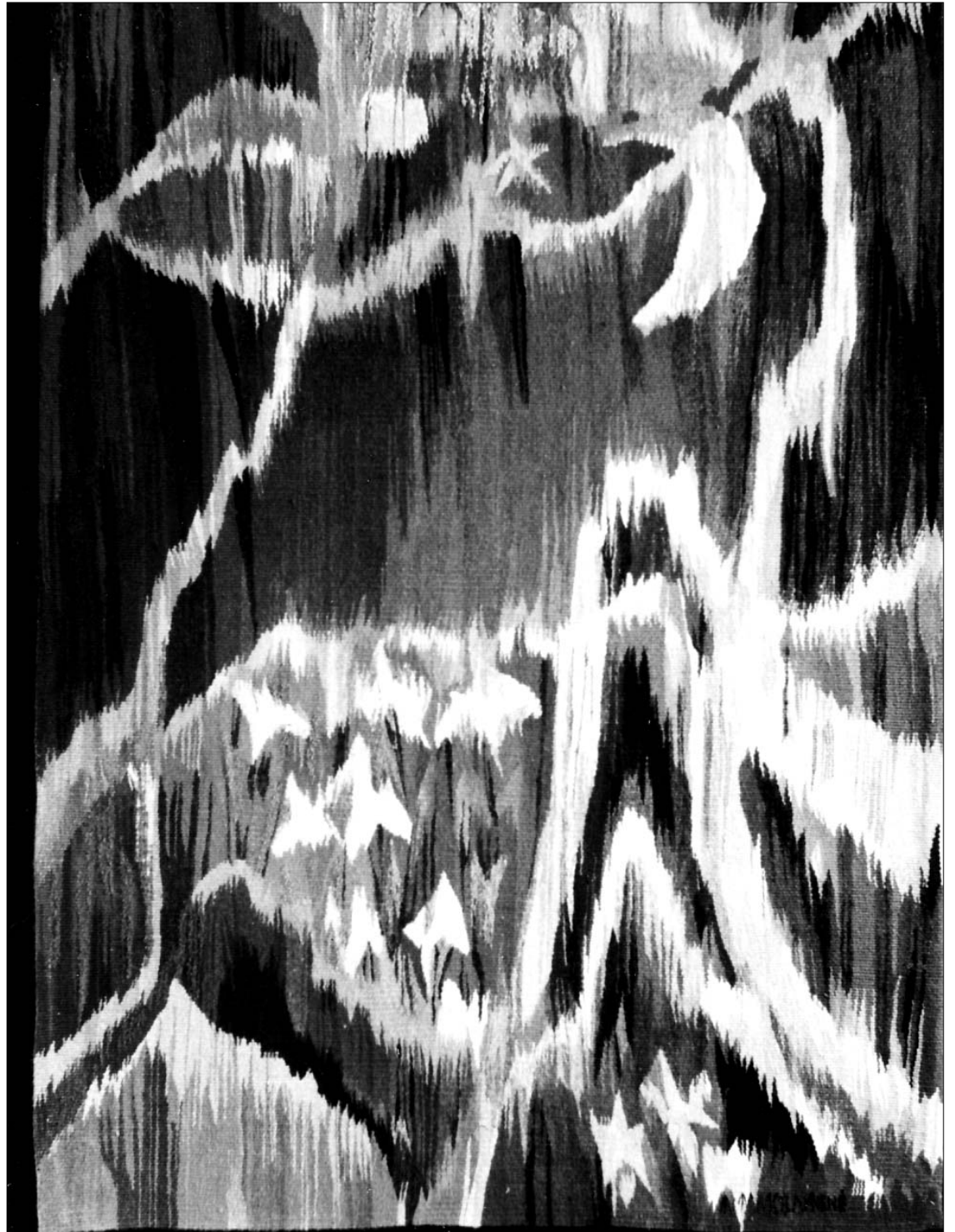
Baltais žiedais pasipuošę Ontario miškai... „Trillium Hills” (gobelenas)