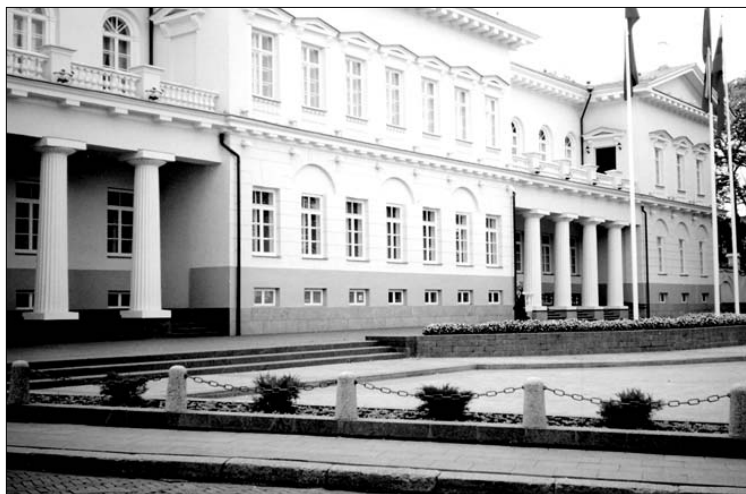
Lietuvos prezidentūros rūmų fasado dalis Vilniuje