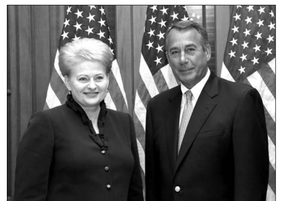
Lietuvos prezidentė, lankydamosi Vašingtone, JAV, susitiko su Atstovų rūmų pirmininku J. Boehner

Prezidentė dar kartą padėkojo JAV už paramą dėl Lietuvos reikalavimų, statant naujas atominės elektrines regione. Lietuva siekia, kad Karaliaučiaus srityje ir Gudijoje statomos atominės jėgainės atitiktų visus tarptautinius saugumo reikalavimus. D. Grybauskaitė Vašingtone susitiko su pasaulyje žinomų verslo kompanijų atstovais ir dalyvavo pirmajame naujai įsteigtos Lietuvos ir JAV verslo tarybos posėdyje. Tai pirmoji tokio pobūdžio organiza-