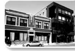
Small Business Rental Properties

Providing commercial property mortgages for our community