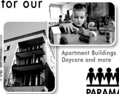
Apartment Buildings Daycare and more