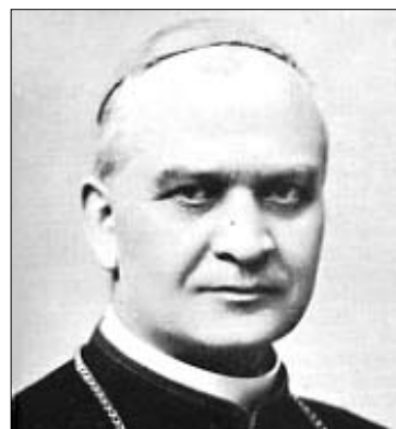
Arkivyskupas J. Matulaitis