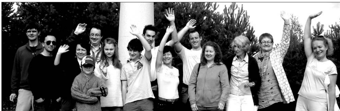
Lingua Lituanica kursų – 2012 dalyviai

Kalbos praktikos centras Lingua Lituanica moko lietuvių kalbos išėjus ir užsienio šalių piliečius, supažindina su Lietuvos kultūra bei žmonėmis