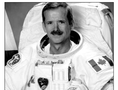
Kanados astronautas Chris Hadfield

Kanados astronautas Chris Hadfield, 53, neseniai sugrįžęs iš 3.5 mėnesio trukusio darbo tarptautinėje erdvių stotyje pranešė, kad užbaigia savo 21 m. trukusią profesinę karjerą. Nuo liepos 3 d. populiarius astronautas atsisveikina su Kanados oro skrydžių agentūra ir Hustono skrydžių centru (JAV), kur gyveno nuo 1980 m. Chris Hadfield tapo pirmuoju Kanados astronautu – tarptautinės grupės vadovu šiame skrydyje. Jo metu buvo atlikta ne tik 130 mokslo bandymų ir stebėjimų, astronautas nemažai laiko paskyrė tiesioginiam bendravimui iš erdvėlaivio su moksleiviais ir jaunimu.