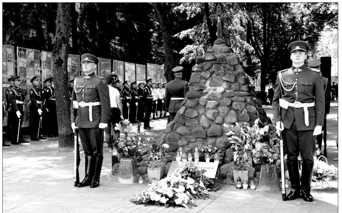
Lietuvos vyriausybės vadovai – prezidentė D. Grybauskaitė, seimo pirmininkas V. Gedvilas ir kiti dalyvavo Lietuvos Gedulo, vilties, okupacijos ir genocido dienos minėjimuose, pagerbdami daugiau kaip 280,000 sovietinės okupacijos pradžioje ištremtų tautiečių, tūkstančių žuvusių kalėjimuose ir lageriuose atminimą