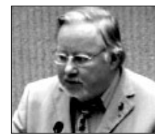
Vytautas Landsbergis, pirmasis Lietuvos Sąjūdžio pirmininkas

Jungėmės, tad organizavomės nuo pat birželio 3-iosios būtent organizuotai veiklai. Kryptingai ir kontroliuojamai, nes chaotiškas maištas prieš blogį būtų buvęs pražūtingas. Geradariai iš valdančiosios sovietinės ir vietinės,