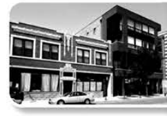
Small Business Rental Properties

Providing commercial property mortgages for our community