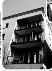
Apartment Buildings Daycare and more