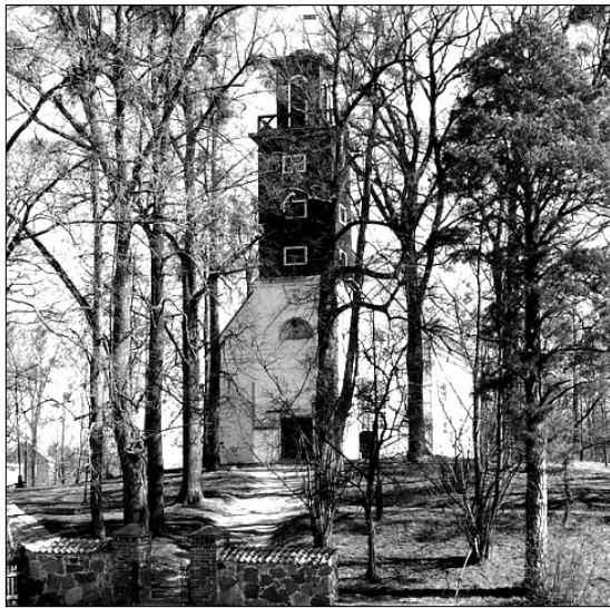
Donelaičio šventovė Tolminkiemyje, Karaliaučiaus sritis

Aleksas Bartnikas, Karaliaučiaus srities