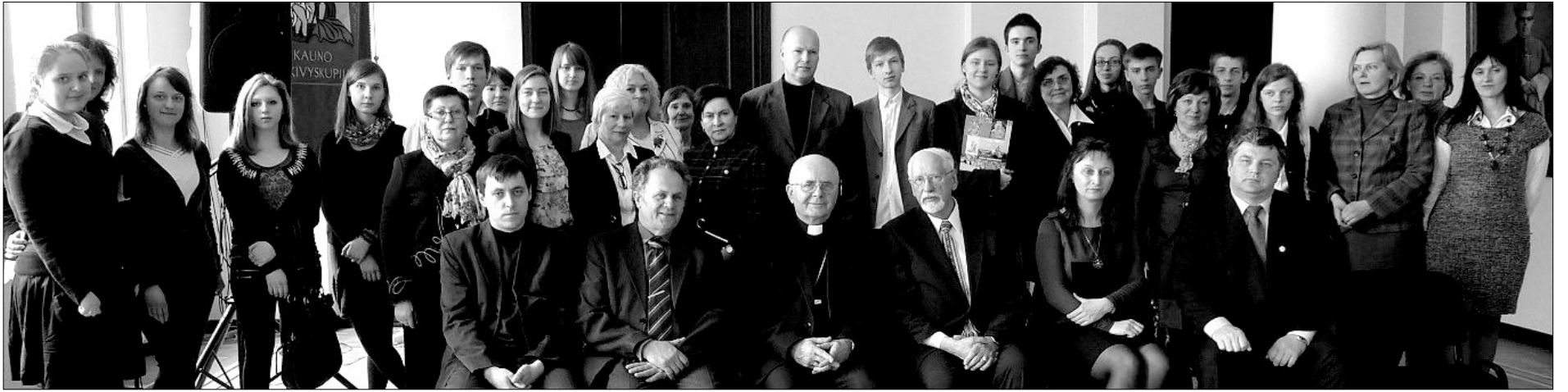
Istorijos konkurso „Tautinės savimonės pasireiškimas disidentinėje veikloje, siekiant prisiminti Lietuvos katalikų bažnyčios kronikos jubiliejų“ organizatoriai, dalyviai ir svečiai Kauno arkivyskupijoje š.m. balandžio 29 d. I eil. sėdi trečias iš k. konkurso globėjas J.E. arkivyskupas metropolitas Sigitas Tamkevičius