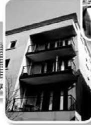
Apartment Buildings Daycare and more