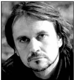
Lietuvos režisierius O. Koršunovas

Norvegijos sostinėje Osle Lietuvos režisieriui Oskarui Koršunovui įteiktas geriausio režisieriaus prizas. Šis svarbiausias Norvegijos teatrų Hedos apdovanojimas režisieriui skirtas už Oslo valstybiniame teatre pastatytą spektaklį pagal Henriko Ibseno Perą Giuntą . Tai jau šeštasis spektaklis, O. Koršunovo režisuotas Norvegijos teatruose.