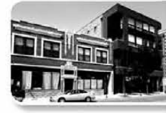
Small Business Rental Properties

Providing commercial property mortgages for our community