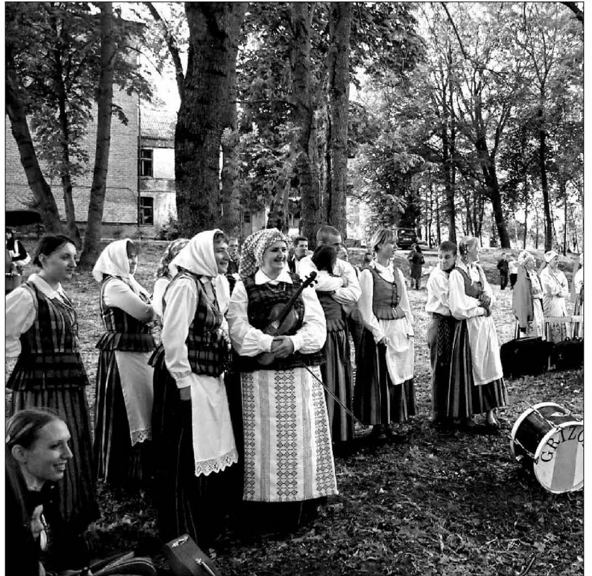
Linksmų gegužinių laikas... Pasilinksinti susirinkę pasvaliečiai...