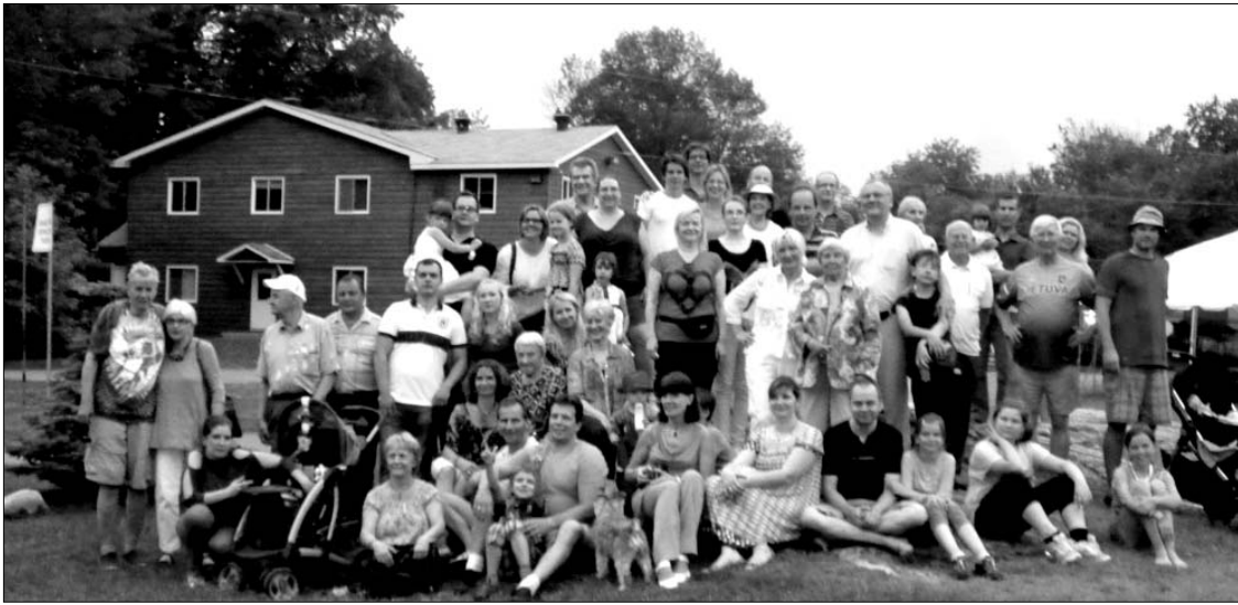
Vietinių lietuvių surengta graži Joninių šventė Otavoje