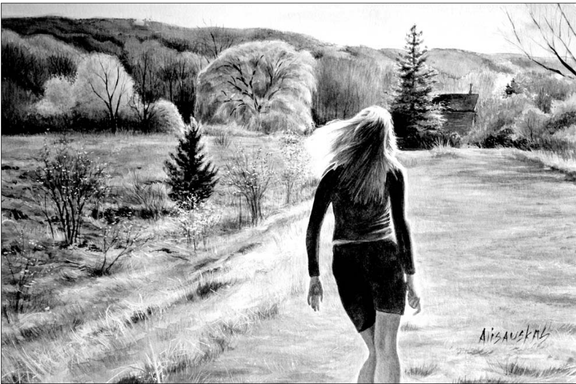
Dail. Ona Ališauskas – Abandoned (akvarelė)