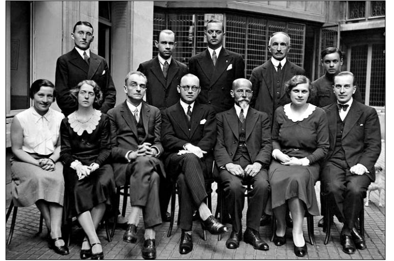
Lietuvos atstovybė Paryžiuje, Oskaras Milašius – trečias iš kairės