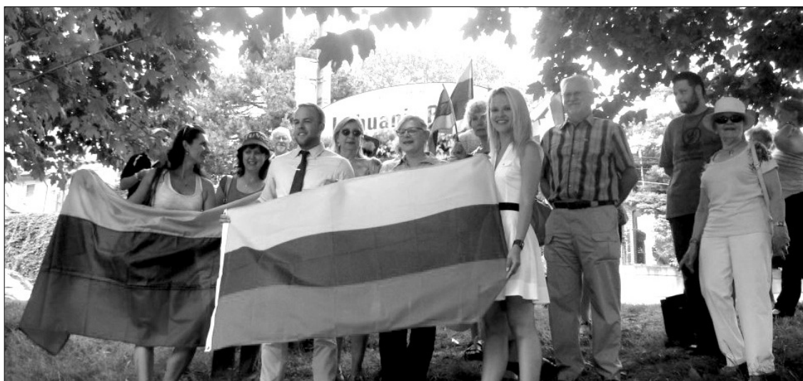
Liepos 6 d. Toronto lietuviai susirinko Lithuania Park, netoli Keele ir Bloor gatvės, sugiedoti Tautos himno Lietuvos valstybės dienos proga

FOR RENT in Georgian Bay/Waubashene area 3-bedroom cottage; sleeps 8; water view-waterfront property; modern kitchen; great fishing; close to attractions in Midland and Orillia. For availability contact: 416 704-0123.