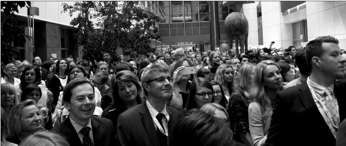
Lietuvos europarlamentarai (viršuje) iškilmėse, Briuselyje, birželio 26 d., atidarant "Baltijos kelio" alėją ir šiam istoriniam įvykiui paminėti skirtą memorialinę lentą, viduryje Lietuvos prezidentė D. Grybauskaitė ir Lietuvos Atkuriamojo seimo pirmininkas V. Landsbergis; apačioje – Europos parlamente Briuselyje į Baltijos kelio įamžinimo iškilmes susirinkę dalyviai