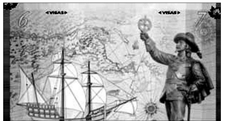
Naujojo e-paso puslapyje įamžintas Kanados tyrinėtojas Samuel de Champlain

Kanados dienos proga mūsų valstybės piliečiai supažindinti su naujo svarbaus asmeninio dokumento – elektroninio paso pavyzdžiu. Atnaujintas Kanados e-pasas turi šiuolaikinius, tik elektroniniu būdu perskaitomus saugos žymenis su paso savininko asmenine informacija ir vandens ženklais. Naujasis e-pasas saugesnis, sunkiau padirbti jų kopijas.