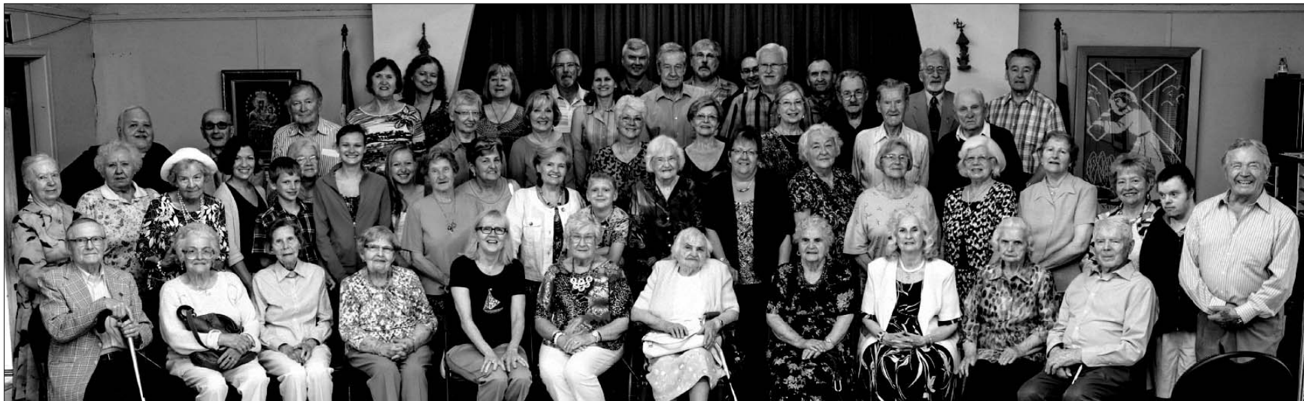
Vasagos lietuviai, susirinkę giedoti Tautos himno Valstybės dienos proga