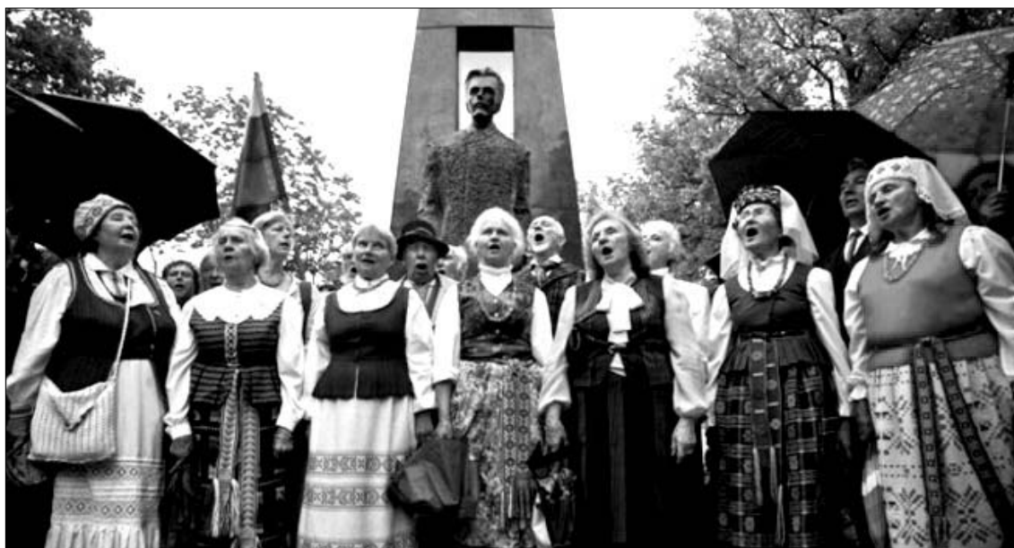
Vilniuje, Nepriklausomybės aikštėje, liepos 6-ąją tūkstančiai vilniečių ir svečių gieda Lietuvos himną