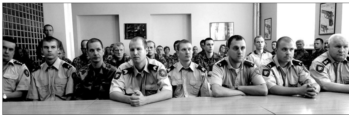
Viešojo saugumo tarnybos pareigūnų šventinis susirinkimas, minint Valstybės dieną ir Lietuvos Sąjūdžio jubiliejinius metus