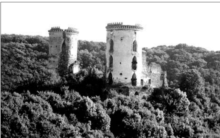
Apie istorinius Lietuvos ir Ukrainos ryšius liudija buvusios Vytauto Didžiojo pilies liekanos Červonograde (Ukraina)

Ukrainos miestai kviečia Vilniaus, Kauno, Druskininkų ir Trakų savivaldybes prisidėti prie bendro turistinio projekto. Susitarimą dėl to paties pavadinimo sąjungos įsteigimo penkių Ukrainos miestų merai pasirašė gegužės mėnesį. „Gediminaičių kelio“ draugijai priklauso Lucko, Chotyinės, Kamenec-Podolsko, Iziaslavo ir Ostrogo miestai, prie jų planuoja prisijungti ir dar keli Ukrainos miestai. Dabar prie iniciatyvos, skirtos su