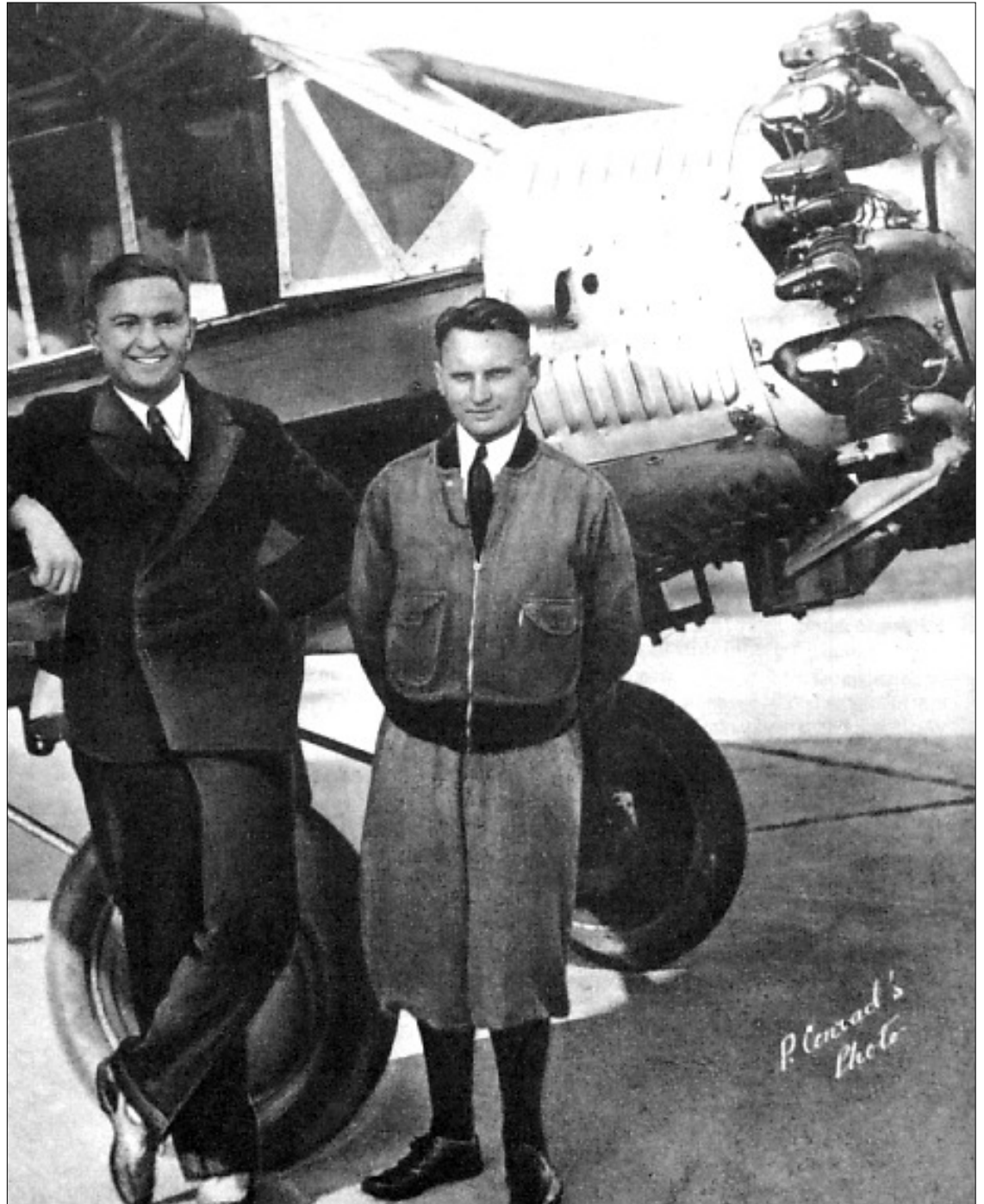
Darius ir Girėnas prie savo lėktuvo "Lituanica", kuriuo prieš 80 metų perskrido Atlantą ir žuvo tuometinėje Vokietijoje, Soldino miške 1933 m. liepos 17 dieną