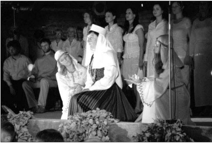
Akimirka iš operos Birutė spektaklio Palangoje Birutės kalno papėdėje

Valstybės šventės proga liepos 6-osios vakarą Palangoje, Birutės parke, prie Birutės kalno, įvyko operos Birutė (komp. M. Petrauskas, libretas – G. Lansdbergio-Žemkalnio) spektaklis. Kompozitoriaus M. Petrausko opera Birutė – pirmasis lietuviškas šio žanro kūrinys. Operos premjera įvyko 1906 m. lapkričio 6 d. Vilniaus miesto salėje (dabartinė Lietuvos Filharmonija). Ši diena – lietuvių operos gimimo diena. Vėliau Birutė buvo pastatyta Čikagoje, Bruklina, Bostone ir kitur, nebuvo užmiršta ir Lietuvoje. Vilniuje surengti jos pastatymo 50-mečio, 70-mečio, 100-mečio minėjimai. Pa-