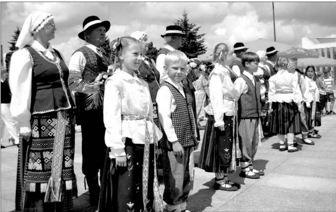
Marijampolėje, Valstybės diena, liepos 6-ąją susirinkę marijampoliečiai gieda Lietuvos himną