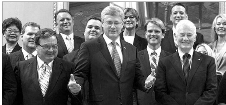
Atnaujinta konservatorių vyriausybė po priesaikos

Ministeris pirmininkas S. Harper paskelbė apie ilgai lauktas permainas vyriausybėje. Atnaujintoje konservatorių vyriausybėje – 8 nauji nariai, pagausėjo moterų. Kaip ir buvo tikėtasi, vyriausybės senbuviai J. Flaherty, J. Baird, Ed Fast toliau vadovaus savo ministerijoms. P. MacKay, gynybos ministras, pasikeitė pareigomis su R. Nicholson. P. MacKay tampa teisingumo ministru, o R. Nicholson rūpinsis gynybos sritimi. Buvusi sveikatos apsaugos ministrė L. Aglukkaq tapo aplinkosaugos, Kanados Šiaurės ir Arkties tarybos vadove. Sveikatos sritis patikėta R. Ambrose. Buvęs paveldo ministras J. Moore tapo pramonės, o į jo vietą paskirta