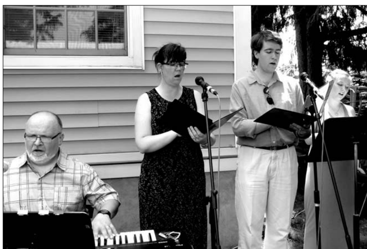
Akimirkos iš Joninių šventės Kanados Londone, ON