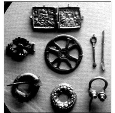
XIV-XV š. segės; apkalas, enkolpionas; pakabutis-amuletas; XV-XVII š. ausų krapštukai

istoriniais vėlyvosios gotikos, renesanso ir ankstyvojo baroko reprezentaciniais interjerais, taip pat į specialią lobyno salę.