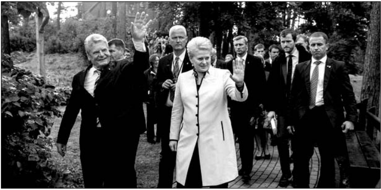
Thomo Mann festivalio svečiai Lietuvos prezidentė D. Grybauskaitė ir Vokietijos prezidentas J. Gauck

Nidoje liepos 13-20 d. vyko vokiečių rašytojo T. Mann festivalis, rengiamas jau 17-tą vasarą. Šiame festivalis užbaigė trejų metų pokalbių ir svarstybių teminį ciklą, skirtą Nobelio premijos laureato Cz. Milosz kūrybai. Šios vasaros festivalio renginiams pasirinktas jo esė rinktinės "Tėvynės ieškojimai" pavadinimas.