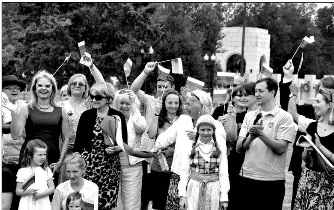
Valstybės diena paminėta Vašingtone liepos 6 d. Tautiškos giesmės giedojimu