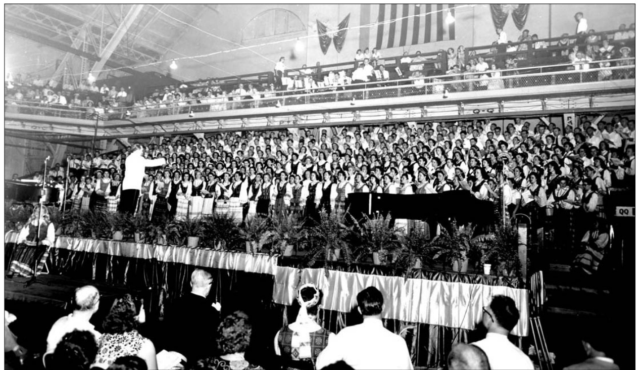
Pirmoji JAV ir Kanados dainų šventė Čikagoje 1956 m. liepos 1 d., joje dalyvavo 1,200 dainininkų

– 2014 metais Lietuvoje vyks Pasaulio lietuvių dainų šventė. Ar suspės ten planuojantys dalyvauti chorai pasiruošti 2015 m. dainų šventei?