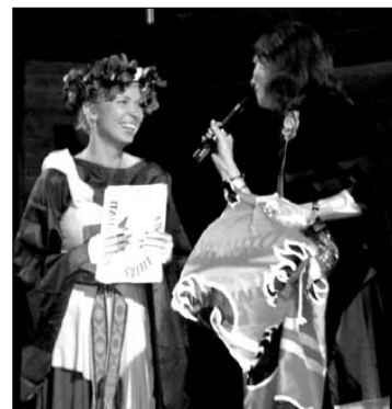
Pristačiusi Kalgario lituanistinei mokyklė, organizatoriams įteikiau "Calgary Flames" užtiesalą, kad po renginio organizatoriai galėtų ramiai numigti

rias pedagogines būkles, diegti naujus mokymo metodus ir dailintis gerą darbo patirtimi.