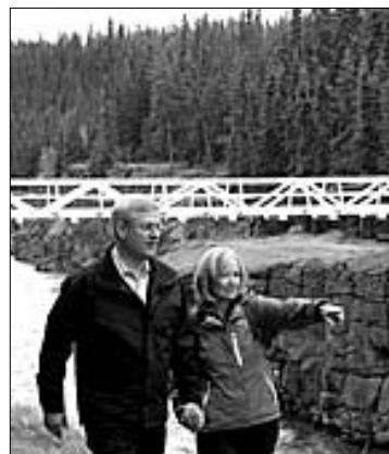
Vyriausybės vadovas S. Harper su žmona Whitehorse apylinkėse

Konservatorių vyriausybės ministeris pirmininkas S. Harper su žmona savaitę praleido Kanados tolimojoje Šiaurėje. Tai aštuntoji kasmetinė kelionė į Kanados šiauri-