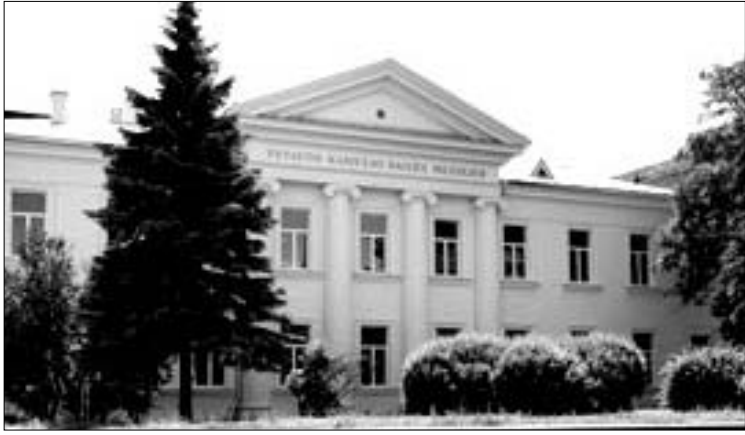
Vytauto Kasiulio dailės muziejus

Vilniaus centre duris atvėrė dailininko Vytauto Kasiulio dailės muziejus. Šio muziejaus atidarymas yra kultūrinės Lietuvos pirmininkavimo Europos sąjungos (ES) Tarybai programos dalis.